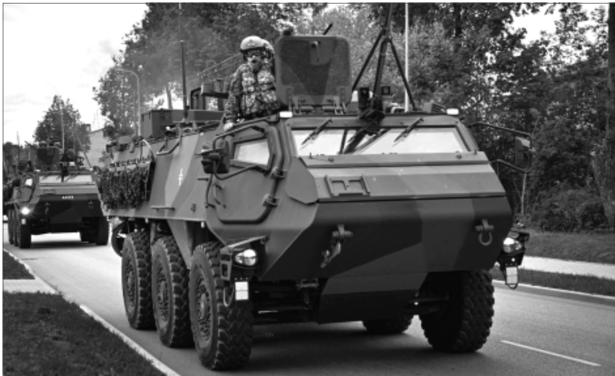
Bruņumašīna "Patria". Zemessardzes un karavīru pārvietošanās laikā Balvu ielās iedzīvotājiem bija iespēja arī vērot dažādu militāro tehniku, tostarp bruņumašīnas "Patria", militārās policijas autotransportu utt.