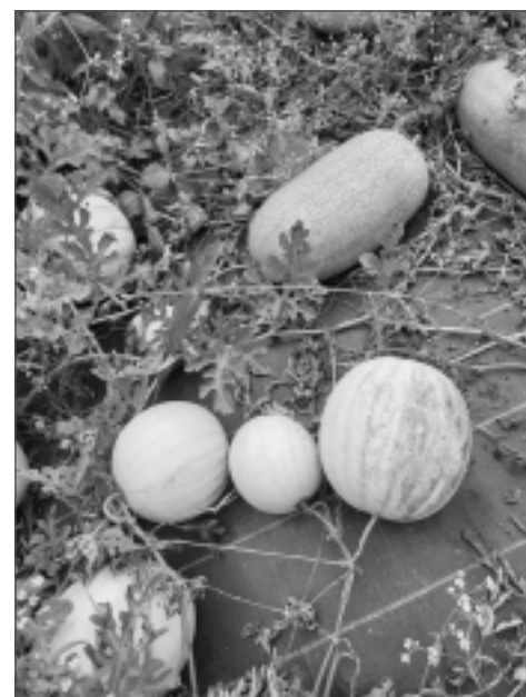
Arbūzi. Pēc novākšanas arbūzus var uzglabāt diezgan ilgi, citi pat uz Ziemassvētkiem mīlojas ar pašu izaudzētiem augļiem. "Ja novāc vēl nenogatavojušos augļus, tie līdz ēšanai jāpatur 2-3 nedēļas tumšā vietā," skaidro saimniece.