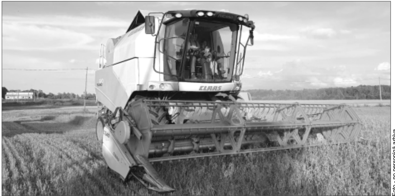
Tehnikas spēks. Kas izaudzis, tas jānovāc.

– Ar lauksaimniecību nodarbojos jau 31 gadu. Lai būtu veiksmīgs zemnieks, visu laiku ir jāpildnveidojas un jāmācās ne tikai no citu, bet lielākoties no paša kļūdām. Tas ir smags darbs, taču rada arī gandarījumu pēc labi padarītā. Reizēm nākas vilties, bet saprotu, ka nedrīkst nolaist rokas, jāplāno darbi nākamajai sezonai un jātic, ka būs labāk! Jāspēj ik dienu novērtēt esošo situāciju, pieņemt laika apstākļus un ātri reaģēt, ja situācija pēc tam atkal mainās. Es mīlu to, ko daru, un nemēdzu ne līlities, ne sūdzēties. Ir tā, kā ir, un būs tā, kā būs! Taču no jauna es vairs neko nesāktu, jo tas prasa daudz laika, spēka un enerģijas, taču arī savādāk neko nedarītu.