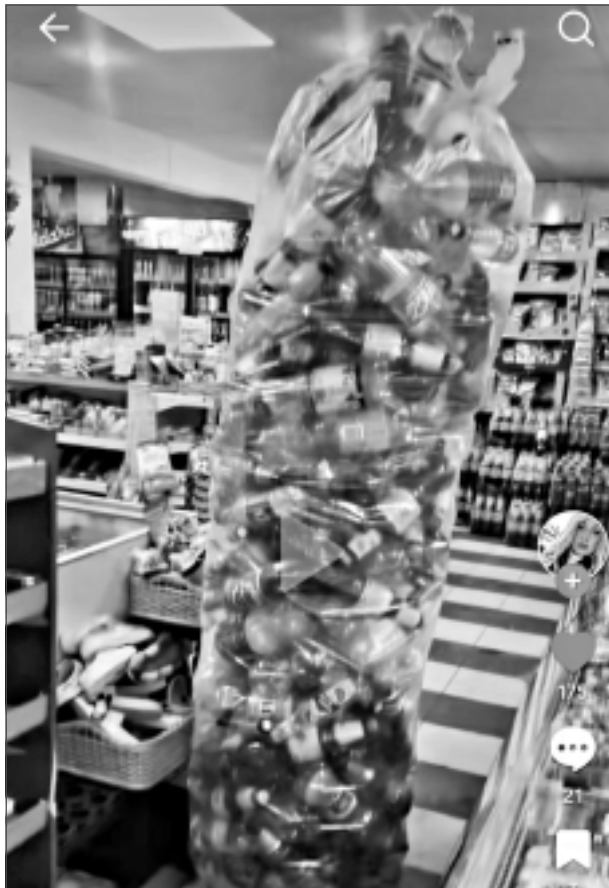
Ekranšāviņš no Sīnijas Velmes video sociālajā tīklā "TikTok"