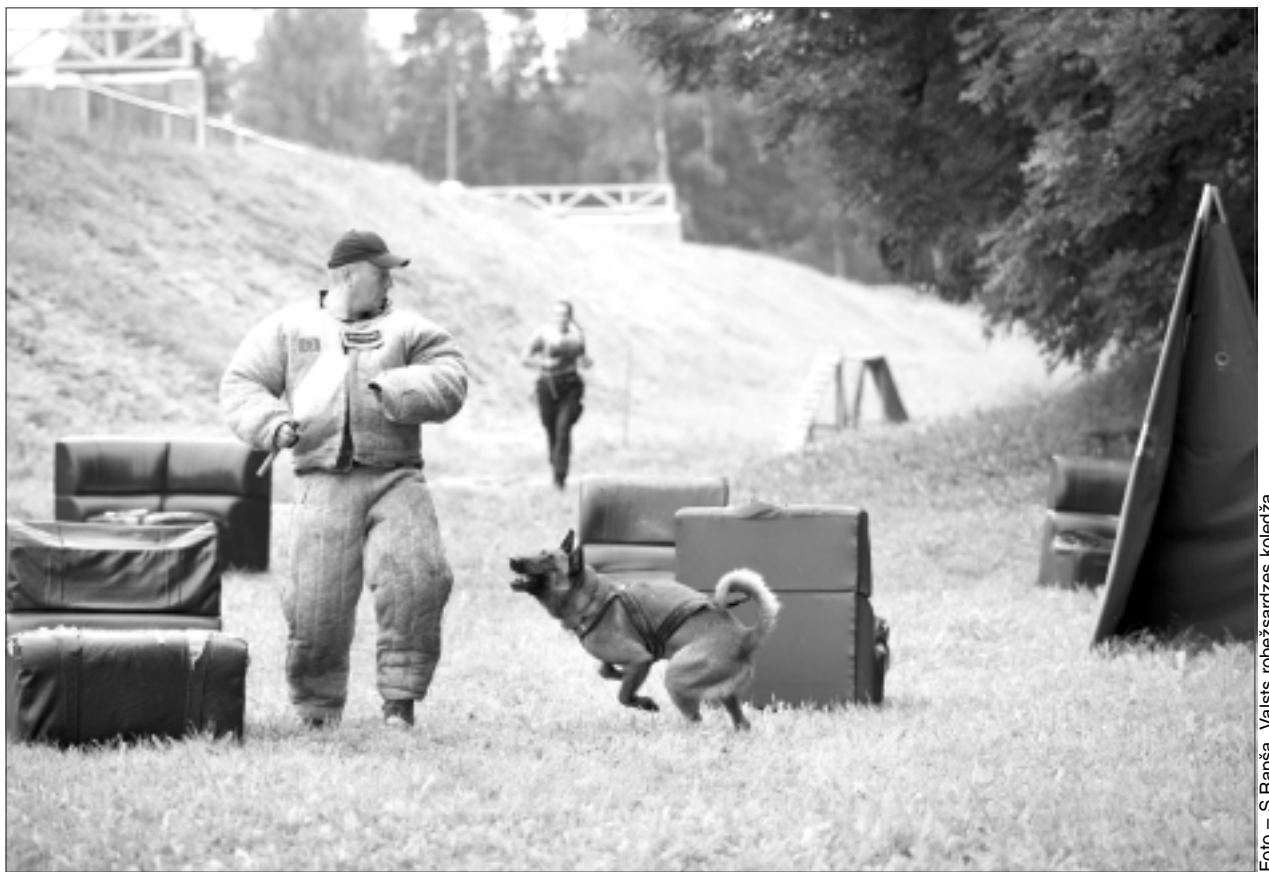
Sacensību dalībnieki darbībā! Kinologiem sacensības nebija viegla pastaiga, jo nācās pārvarēt dažādus šķēršļus.

izcīnīja komanda “Zemgales kinoloģiskais klubs”, 2.vietu – komanda “Link Tiklo”.