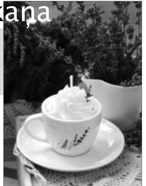
Lavandu aromāts. To iespējams izbraudīt gan ziedos, kas sasieta saišķiņšos, gan svecēs.

Balvu novada svētku laikā 15.jūlijā Balvu parkā notika zaļais jeb lauku labumu tirdziņš . Tajā varēja ne tikai pārdot un iegādāties dažādas garšīgas ēdamlietas, bet arī amatnieku, rokdarbnieču un mākslinieku darinājumus. To tiešām šoreiz bija ļoti daudz, un visi – tik neparasti skaisti gan krāsu ziņā, gan praktiski, kas pierāda mūsu cilvēku prasmi pielāgoties jaunajam un izdomāt lietas, kas piesaista pircējus ar ikdienā skaistām un noderīgām lietām.