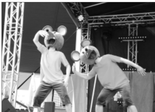
Esiet sveicināti! Žurku puikas Koko un Riko ģimenēm veltītajā koncertuzvedumā paziņoja: “Lai saruna var turpināties, vajag ļoti sasveicināties.”