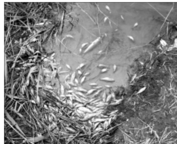
Beigtas zivis. Šīs zivtiņas varēja izaugt par lielām un skaistām zivīm.

Diemžēl neatbildēts palika jautājums, – vai iespējams kaut ko darīt, lai šādas situācijas novērstu?