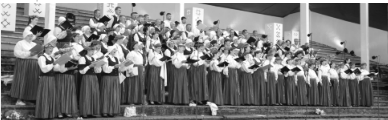
Paldies! Aplausus novada svētkos saņēma kultūras centra "Rekova" jauktais koris "Viola", Rugāju jauktais koris "Vārpa", Tilžas sieviešu koris "Varavīksne", Balvu senioru koris "Pīlādzis", Baltinavas jauktais koris, Balvu novada jauktais koris "Mirklis".