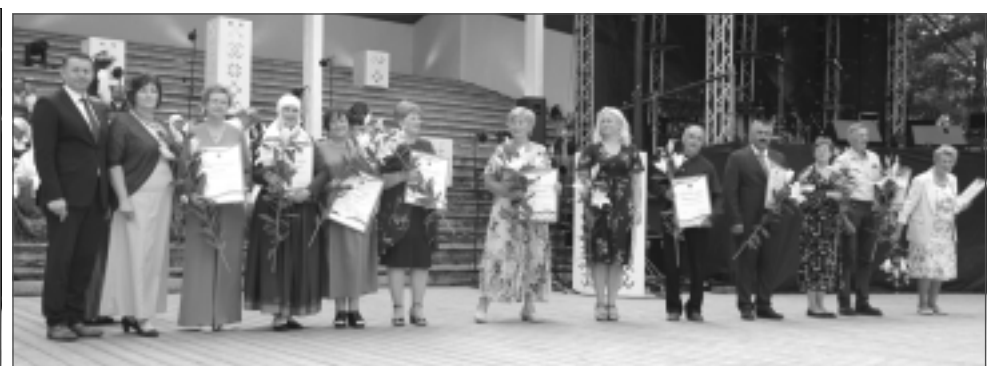
Ir, ar ko lepoties. Šogad Balvu novada domes Atzinības rakstus piešķīra astoņpadsmit darbarūķiem.