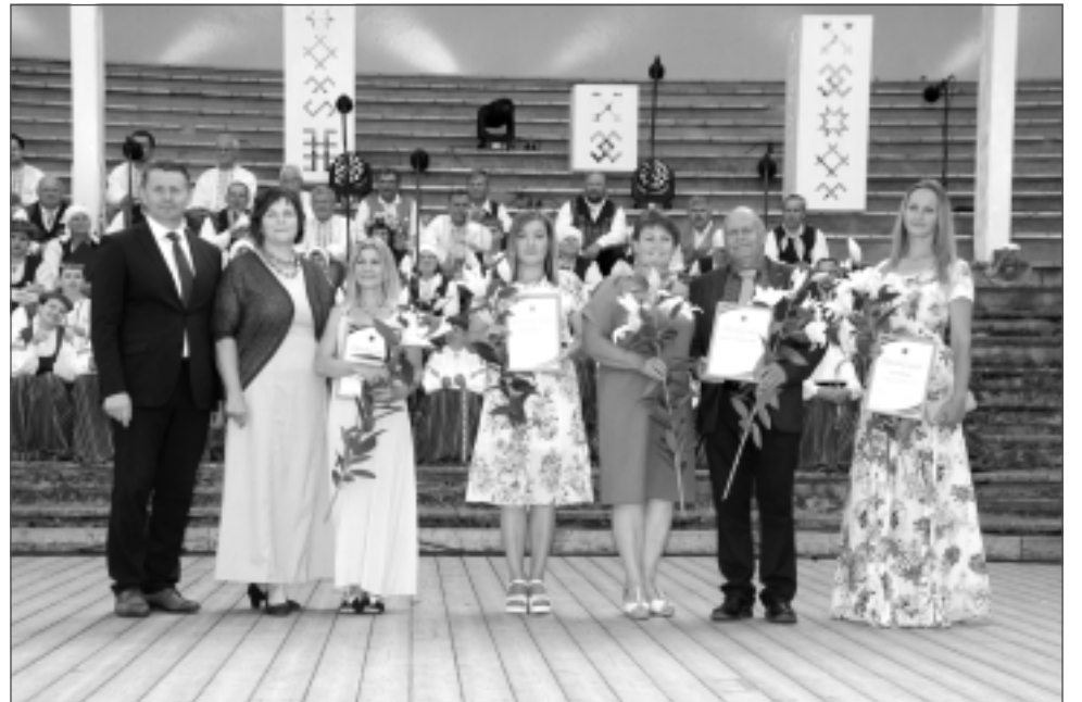
Sumina labākos. Pateicības rakstus saņēma pieci darbarūķi.