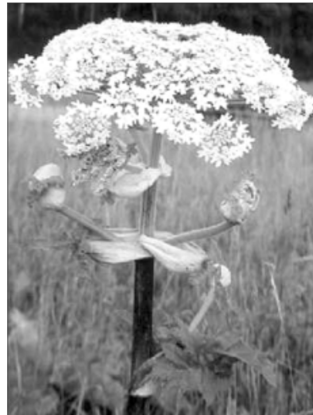
Latvānis. Latvijā aizliegts audzēt un ievest invazīvo sugu – Sosnovska latvāni. Ikvienam jāinformē Valsts augu aizsardzības dienests par teritorijām, kur aug Sosnovska latvānis.

Sosnovska latvānis – sveša, agresīva un invazīva suga, un vienīgais, kas var to ierobežot un ir stiprāks par to, ir cilvēks. Tam patiek augt visas Latvijas teritorijās, šobrīd nav sastopams tikai Ventspilī no visām administratīvajām valsts pilsētām un novadiem. Sargājot savu teritoriju un vietējos augus no svešajām, invazīvajām sugām, mēs sargājam sevi paši, jo nodrošinām teritorijas ilgtspējību un stabilitāti.