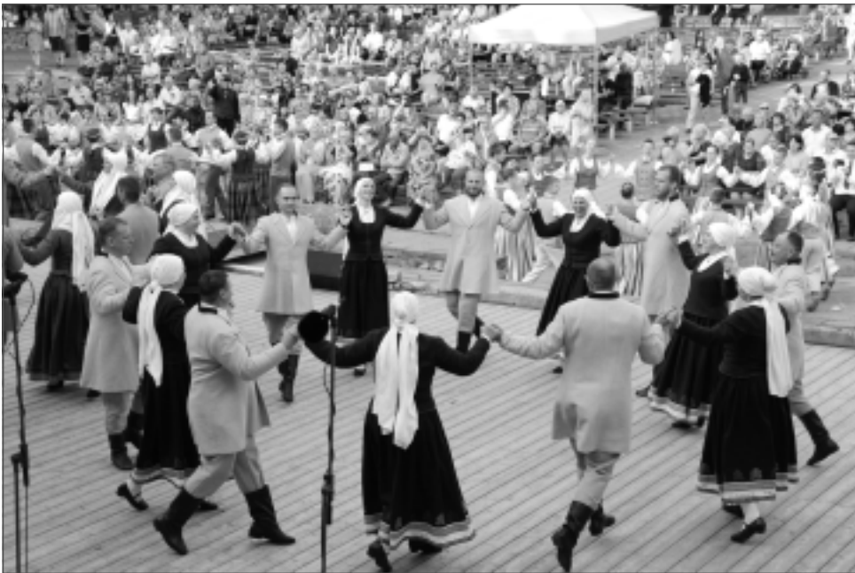
Lai raits solis! Balvu novadu septiņpadsmitajos deju svētkos pārstāvēja 12 tautisko deju kolektīvi. Savas prasmes dejotāji apliecināja arī Balvu estrādē.