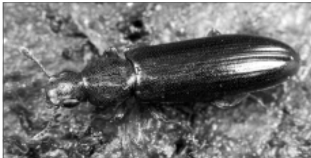
Šneidera mizmilis. Šneidera mizmilis ir vienīgā mizmiļu suga Eiropā, kas īpaši aizsargājama, jo reti sastopama.

Pērtupes meži tiek veidoti kā dabas liegums, lai saglabātu Eiropas Savienības nozīmes mežu biotopus – vecus vai dabiskus boreālus mežus, staignāju mežus, purvainus mežus un aluviālus mežus, kā arī neskartus augstos purvus. Kopējā gandrīz 272 ha lieguma platība sastāv no septiņām nodalitām lieguma daļām, kurās gandrīz 70% veido biotopu platības. Jaunais liegums ietvers jau iepriekš veidotu mikrolieguma platību. Teritorijā atrodas pūcēm, dzeņiem, mednim un citām īpaši aizsargājamām putnu sugām piemērotas dzīvotnes. Teritorijā konstatēta samērā liela, vitāla parastā plakanstaipekņa