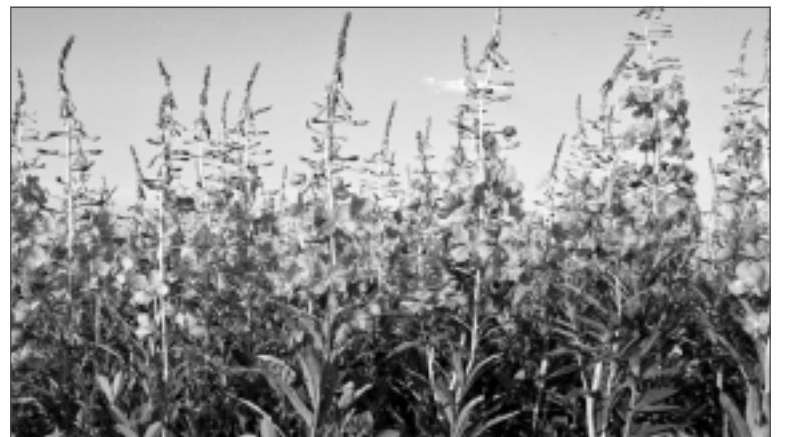
Leģenda vēsta, ka ūdens dieviete atpeldējusi pa naksnīgo debess jumtu sudraba laivā un sējusi pār Zemi augu sēklas, lai dziedinātu cilvēkus. Pirmā pirms rītausmas uzplauka ugunspuķe, kas nakti mirdzēja ugunīgi violetā krāsā.

Ugunspuķes jaunās lapiņas uzturā var lietot no pavasara salātos, zupās, tējai. Tēju var apliet vairākas reizes (2-3 reizes), – spēcīgā sastāva dēļ lapas turpinās izdalīt vērtīgas vielas.