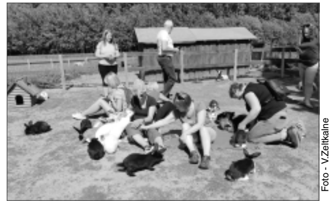
Samīļo trusišus. Balveniešiem bija iespēja apmeklēt saimniecību, kas atrodas netālu no Zaļā ceļa. Padomāts par uzņēmējdarbību un tūristu piesaisti.

“Jā, zinu, ka mūsu tūrisma aktīvisti apmeklēja Īriju un ka bijušie dzelzceļi ir slaveni visā Eiropā. Jā, pie mums tie skati varbūt nav tik skaisti, kā citās Eiropas valstīs. Mums gar ceļa malām vairāk redzami meži, bet arī tas ir interesanti. Patī ar skolēniem esmu braukusi pārgājienos pa veco dzelzceļu uz Viksnas pusi, kad bijušais dzelzceļš vēl nebija Zaļais ceļš. Šobrīd uz Viksnu esmu braukusi kādu pusceļu, bet uz Situ diemžēl braukusi neesmu, lai gan teic, ka tur ceļa segums ir vēl labāks