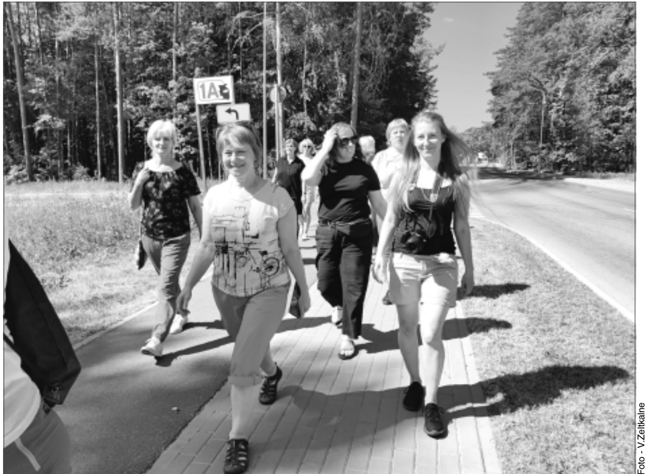
Pa Vidzemes Zaļajiem ceļiem. Balvenieši izbaudīja Vidzemes Zaļos ceļus, ejot kājām, kas arī ir viens no tūrisma veidiem.

Jautāts, vai pats arī ir pamēģinājis izbraukt Zaļo ceļu ar velosipēdu, J. Žukovskis teic: “Nē! Ar velosipēdu man kaut kā grūti. Nav arī laba velosipēda. Kad Vidzemē septiņus kilometrus nācās noiet kājām, jutos daudz labāk, nekā braucot ar velosipēdu. Ričuks nav manējais! Fakts. Vidzemē mums