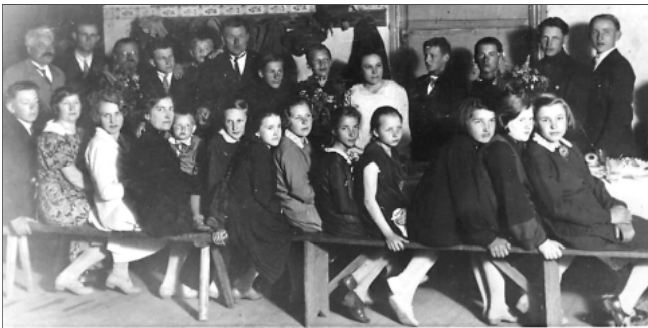
Puķīša skolu beidzot 1930.gadā. Fotografijas ir neatkārtojama sava laika vēsture.

uzlabotu. Izdomāja, lai novērstu nesekmību, ieviest soda sistēmu: par katru divnieku kopējā kasē vainīgajam jāiemaksā 5 santīmi. Tolaik puikām tā bija liela nauda. Bet goda lieta prasīja, vai nu naudu sadabūt, vai arī tikt vaļā no divniekiem. Divnieki gāja mazumā, taču krājās arī nauda kopējā kasē. Naudas krājums savukārt rosināja sarīkot pēc skolas eksāmeņiem ballīti, dodoties vasaras brīvdienās, kas notika Bolupes krasta pļaviņā. Vēlāk ar ēdieniem un dzērieniem zēniem bija vēl līdzīgas ballītes, tikai tad jau mājās pie kāda klasesbiedra.