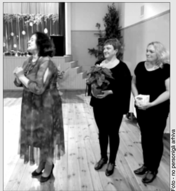
Sveic novadniece. Briežuciema "Optimistes" jubilejā sveic novadniece no Sēlijas.