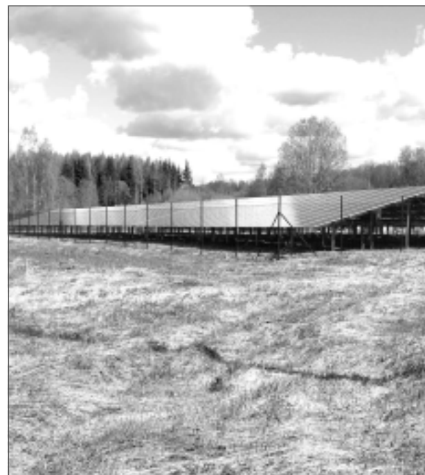
Iespaidīgs skats. Mežu un krūmu ielokā uzstādītie saules paneļi rada iespaidīgu skatu. Moderni, – var teikt īsumā! Lappusi sagatavoja I.Zinkovska

Elektroenerģijas jautājums Latvijā tagad ir svarīgāks nekā jebkad gan lielajiem uzņēmumiem, gan mājsaimniecībām. Nesen pirmo reizi Saeimā notika nacionālā līmeņa enerģētikas forums “Vai Latvijai ir nepieciešama ilgtspējīga, Latvijas tautsaimniecības interesēm atbilstoša enerģētikas stratēģija”, pulcējot gan lēmumu pieņēmējus un enerģētikas politikas veidotājus, gan ekspertus, gan uzņēmējus. Ja valsts neatrisina fundamentālos enerģētikas jautājumus, tās ekonomika būs ļoti vāja, no kā cietīs arī iedzīvotāji. Tādēļ arī iedzīvotāji steig uzstādīt saules paneļus, kur vien un kam vien tas ir iespējams. Eiropā saules paneļi pazīstami jau ilgāku laiku. Pie mums to uzstādīšana tikai tagad sāk uzņemt apgriezienus.