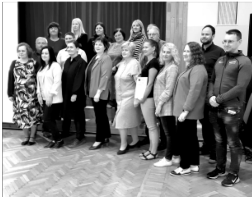
Prezentācijas dalībnieki kultūras namā. Latvijas Zaļo ceļu prezentācijā piedalījās sadarbības partneri, velotūrisma aktīvistu no Balvu, Gulbenes, Ropažu novadiem un Vidzemes tūrisma asociācijas pārstāvji.