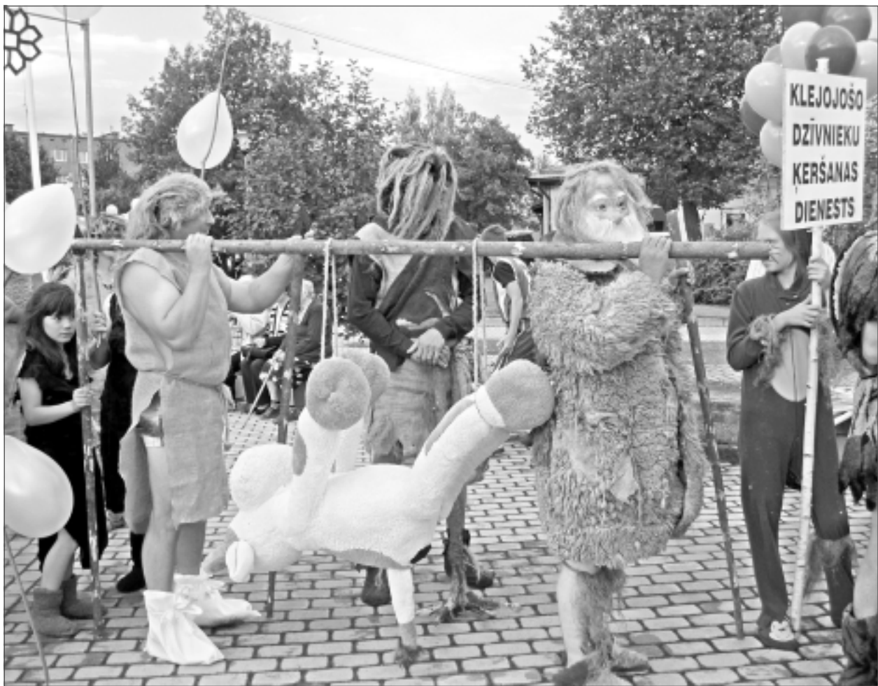
Nu jau vēsture? 2014.gada augustā Balvu novada svētkos “San-TeX” kolektīvs iejutās pirmatnējo cilvēku lomās.

– Arī gara epopeja. Ja nemaldos, tad pēdējā gada laikā bijuši četri uzņēmēji, piedāvājot dažādas tehnoloģijas.