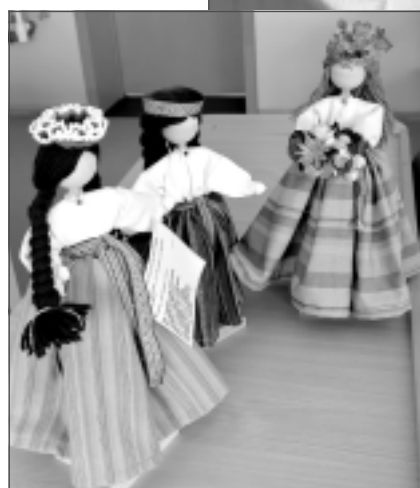
Atšķirīga pieeja. Balvu Profesionālās un vispārīgglītojošās vidusskolas 9. klašu audzēkņi nolēma uzmeistarot koka lelles, ietērtas tautas tērpos, bet ziedus iestrādāt leļļu vainagos.