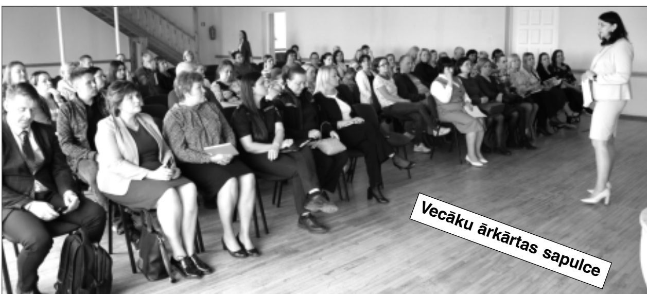
Vecāku ārkārtas sapulce

Vispirms ļoti būtiski ir tas, ka par skolēnu nesaskaņām, visticamāk, bija zināms jau iepriekš, tajā skaitā no konkrētu vecāku puses. Zināms, ka jau iepriekšējā vakarā tas pats 24 gadus jaunais vīrietis konfliktēja Bērzkalnē un, kā laikrakstam "Vaduguns" apliecinājuši vairāki cilvēki, visticamāk, izmantoja arī šaujameroci. Vairāki cilvēki apliecinājuši, ka neilgi pirms konflikta pie skolas bija arī kāds cits gadījums, kurā atkal bija iesaistīts šis pats vīrietis, un par ko konkrētiem vecākiem noteikti vajadzēja ziņot policijai, bet tas netika darīts. Ja tas tā bija, kāpēc netika ziņots? Atbildes nav. Tātad šis ir ļoti nopietns pieaugušo cilvēku atbildības jautājums. Diemžēl arī māte vienam no skolēniem, kurš tiešā veidā bija iesaistīts konfliktā pie skolas un šajā lietā ir kā cietušais, nebija pretimnākoša sarunai ar laikrakstu "Vaduguns". Savukārt tā skolēna māte, kura brālis pie skolas visu risināja ar beisbola