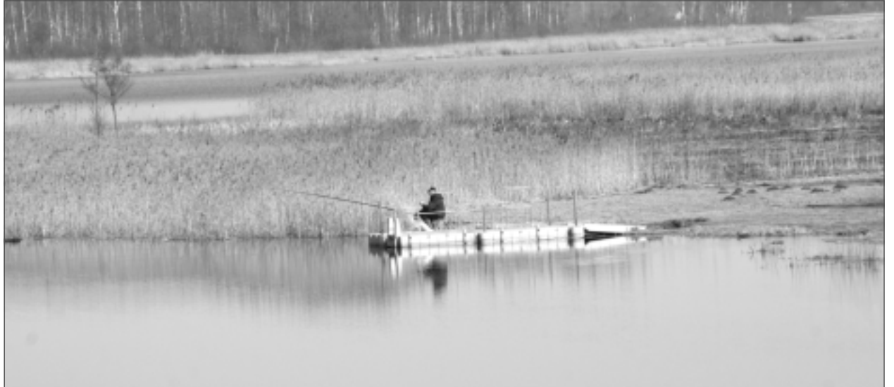
Novada ezeri. Tāpat kā citi Latgales novadi, arī Balvu novads ir ezeriem bagāts, tikai jāprot to piedāvājumu paņemt.

Runājot par ezeru ekspluatācijas un apsaimniekošanas noteikumiem, J. Bubnovs informēja, ka tie izstrādāti un apstiprināti četriem ezeriem – Kaļņa, Svātiunes, Obeļovas un Viļakas, bet izstrādes procesā ir Bolvu (Balvu) un Pārkunu (Pērkonu). “Šie divi mazliet aizkavējas sakarā ar Balvu muižas apbūves teritorijas plānojumu, jo vēlējamies saprast, vai nebūs izmaiņas zonējumā, lai šie dokumenti būtu saskaņā viens ar otru.