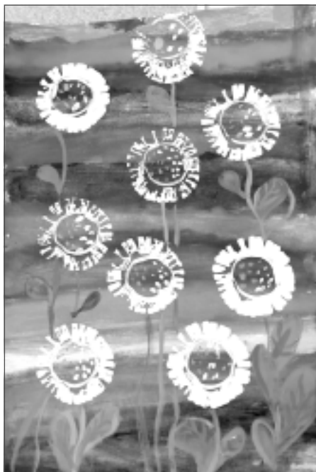
Uzvarētājs. Vizuālās mākslas darbu konkursā jaunākajā klašu grupā uzvarēja Baltinavas vidusskolas 2. klases audzēknis Eduards Supe ar darbu "Baltie ziedi".