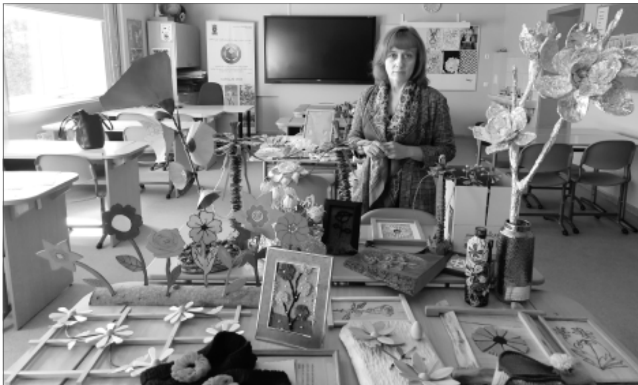
Ir, ko redzēt. Tā ir tikai neliela daļa no vizuālās un plastiskās mākslas darbiem, ko novada skolēni iesūtījuši konkursam "Burvīgie ziedi". Diemžēl konkursam veltīta izstāde šoreiz izpaliks, bet tos varēs aplūkot virtuālajā vidē.