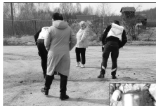
Notikuma vieta. Valsts policijas darbinieki pēc konflikta apskatīja notikuma vietu. Otrajā attēlā redzama lode pēc šaujamerocā pielietošanas.