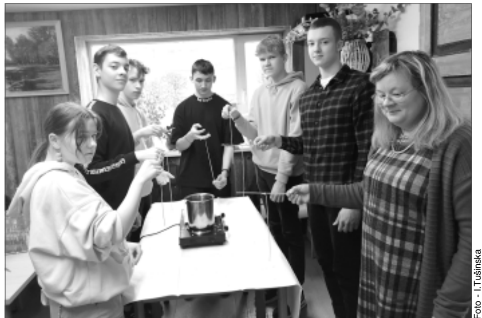
Darbs radošiem cilvēkiem. Vairāki ģimnāzisti izvēlējās ēnot studijas "Azote" darbiniekus, jo gribēja uzzināt, ko tad šeit īsti dara. Izrādās, studijā nereti notiek dažāda veida radošās darbnīcas, un vienā no tām iesaistījās arī ēnotāji .