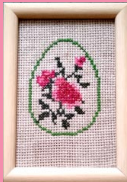
“Lieldienām jābūt” “Mājputnu tracis”