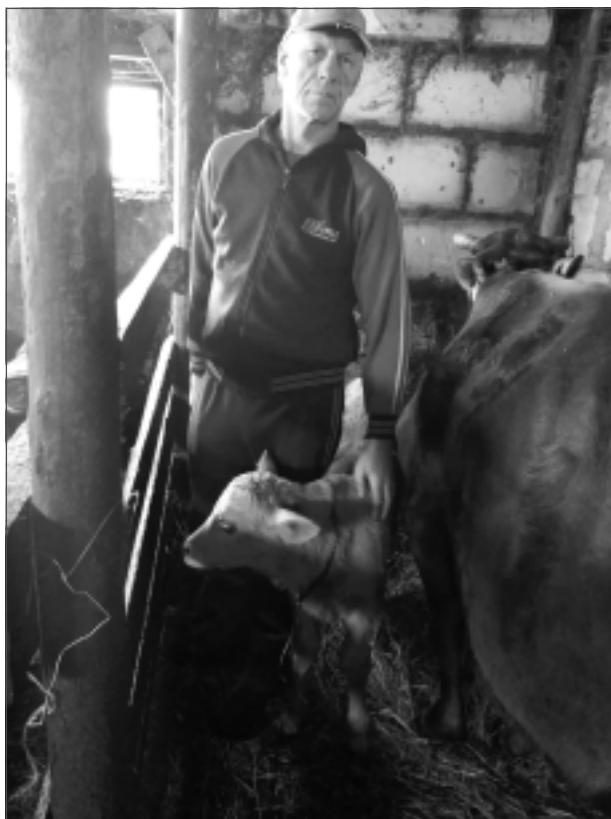
Saimnieks ar brūnajām. Mazo teliņu zeltaini brūnajā krāsā sauc Māra, jo dzimusi 25. martā.

Teliņi dzimst visu gadu, jo saimniece uzskata, ka tā ir labāk un mierīgāk, nevis, ja sadzimst visi reizē. Šogad interesanti, ka pagaidām dzimst tikai telītes, kā saka, raibas kā Lieldienu olas. Parasti bullēnu un lielāko daļu teliņu pārdod, bet kādas 3-5 sarkanraibas, melnraibas vai brūnas telītes atstāj saimniecībā audzēšanai. “Ja vajag, palīdzam teliņiem nākt pasaulē. Tagad telēni dzimst lielāki, kā jau šķirnes lopi. Pricējāmajiem par katru piedzimušo, atstājam uz dažām dienām viņu pie mammas, vēlāk liekam aizgaldā. Cits ātri iemācās dzert pienu no spaiņa, ar citu ir grūtāk, bet visi ir mierīgi un nosvērti,” stāsta saimniece. Teliņu dzimšanas laiks saimniecībā ir pats priecīgākais, jo gaidās, kas piedzims, domā, kādu vārdu dos, un tā ņemšanās ar jaundzimušā barošanu un gotiņas, īpaši, ja viņa ir pirmpiene, ieslaukšanu arī ir patīkama, jo govīs saimniecei nesper, cita pat kāju nepaceļ. Vēl priecīgi brīži saistās ar ganāmpulka došanas ganos pēc ilgā ziemas perioda, kad lopiņiem ātrāk gribas izlocīt kājas un noplūkt pirmo svaigās zāles kušķi. Saimnieki tad vēro, kā govīs uzvedas aplokā, vai ir draudzīgas. Sava loma kārtības uzturēšanā ir barvedei Irsei – deviņus gadus vecajai LB šķirnes govij. Viņa ganāmpulkā ir vecākā, tādēļ pārējās Irsi respektē. “Parasti