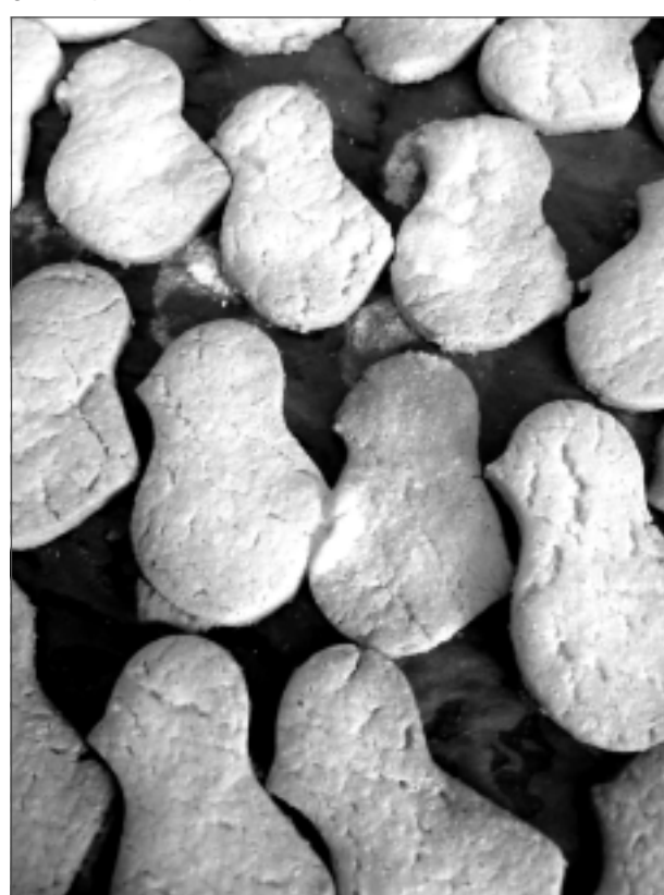
Cepumiņi. Lieldienu tuvums jūtams gan dabā, gan saimnieces gatavotajos kārumos.