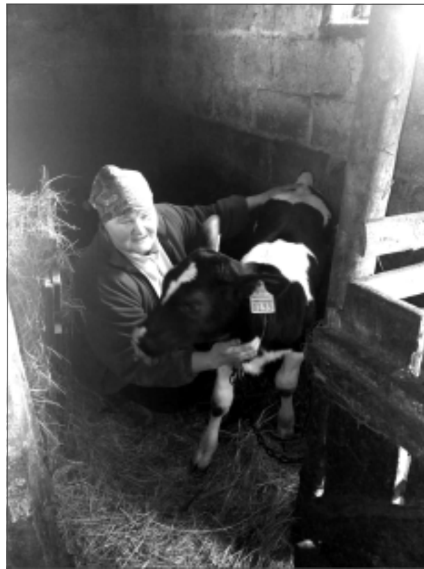
Saimniece ar raibalīti. Prince ir viena no šogad dzimušajām teliņēm (viņai ir arī dviņumāsa Upenīte), kuru audzē ganāmpulka atjaunošanai.