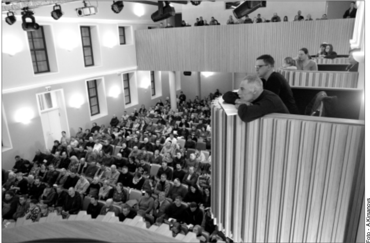
Pilna zāle. Informatīvo semināru Balvos apmeklēja vairāki simti lauksaimnieku. Bija aizņemtas visas vietas Balvu Kultūras un atpūtas centra lielajā zālē, un klausītāji izvietojās arī otrajā stāvā – balkonā un ložās.

– Jaunajā Kopējās lauksaimniecības politikas Stratēģiskajā plānā ir daudz jaunu terminu. Galvenokārt tie saistīti ar videi un klimatam draudzīgu saimniekošanu. Vairākkārt lasot un klausoties atbalsta nosacījumus, jau sāku pierast pie tiem. Galvenais – saprast, ko tie nozīmē. Dažiem, kuriem lauksaim-