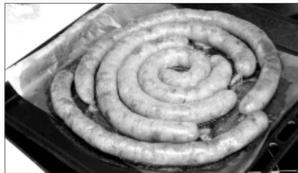
Siekalas saskrien mutē! Redzot kartupeļu desas izceptas, kas ieguvušas zeltaini brūnu nokrāsu, siekalas saskrien mutē. Saimniece tās piedāvāja baudīt ar ērkšķoģu čatniju, bet var arī ar krējumu, kečupu vai majonēzi. Gaumes lieta!