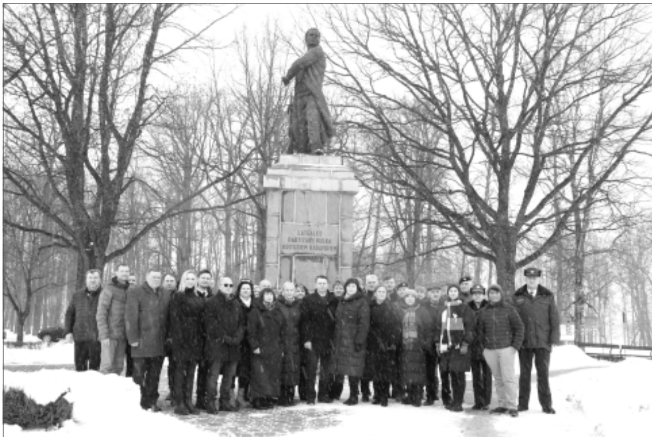
Kopbilde. Nacionālo partizānu bruņotās pretošanās atceres dienas pasākumos piedalījās gan skolēni, gan deputāti, gan arī Latvijā pazīstami cilvēki.