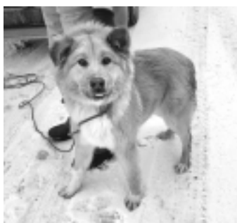
Mīlīga kucīte meklē jaunus saimniekus. Zvanīt pašvaldības policijai, tālr. 29445114.

Divu cilvēku brigāde veic dažādus remontdarbus. Nodrošinām pilnu remontdarbu ciklu no A -Z, ieskaitot demontāžu, kā arī paši sagādājam visus nepieciešamos materiālus. Tāl. 28718716.