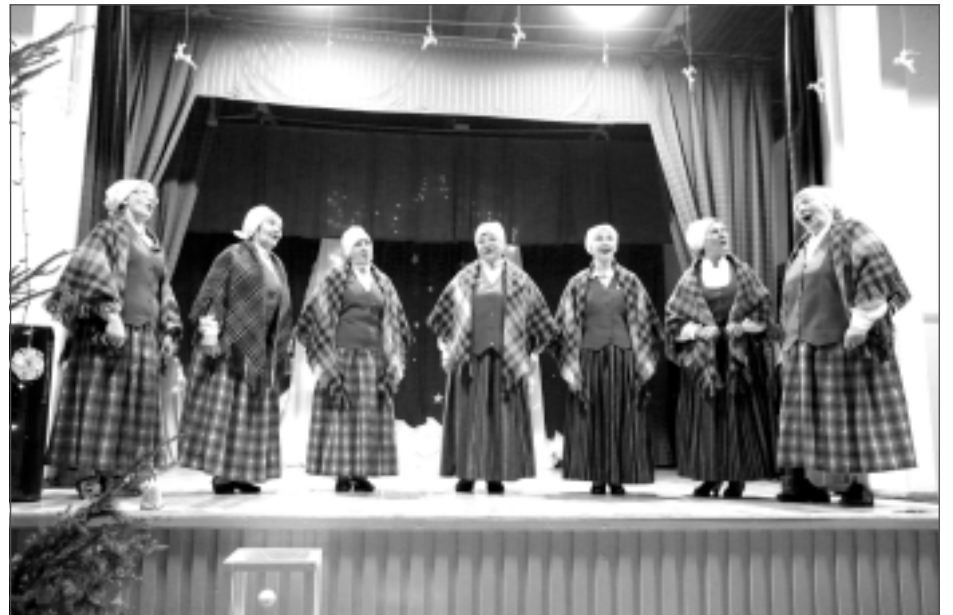
Vēl vienas jubilejas gaidās. Briežuciema etnogrāfiskais ansamblis šogad svinēs kolektīva 45. jubilejas pasākumu.