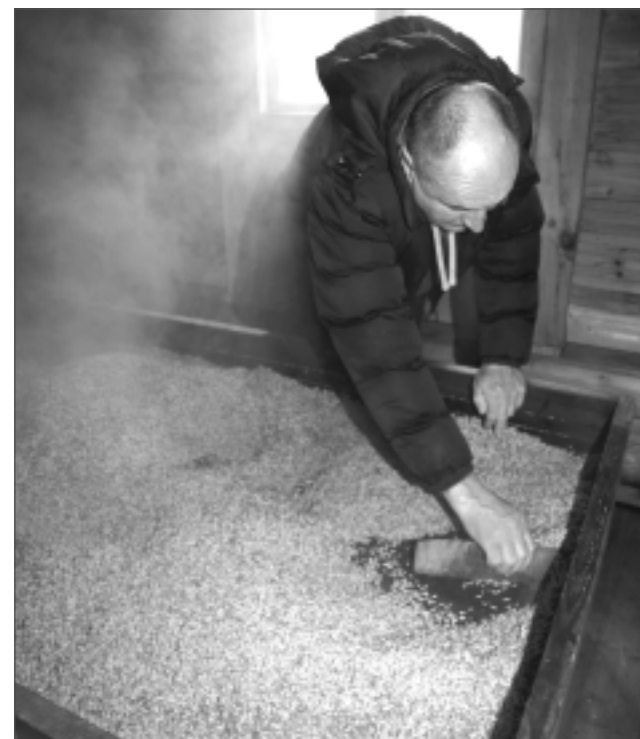
Īsola kaļteišona. Attālā radzams īsola kaļteišonys process, kod mīži teik žuoveiti ai dyumim, kas it nu zamuškā asūšuos malnuos pierts. Kūpā jamūt vysam ola vuoreišonys procesam – nu suokuma da mīsteņa ceļšonai goldā – vādzeiga vysmoz nedeļa. Juosoka, ka “Kolnasātys” muojis ols ir nefiltrāts i nav ni ciši vīglis, ni ari puori mārām styprs – tam ir 5,6 grādi.