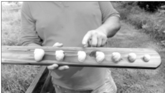
Nosaka gliemežu vecumu. Gliemeži dzīvo līdz deviņu gadu vecumam. Lai gliemeži sāktu vārit, viņš aug trīs gadus. Gliemeža vecumu nosaka pēc čaumalas diametra.

– Tolaik daudz rakos internetā un, meklēdams, ko darīt, atradu, ka Durbē, Liepājas pusē, notiks seminārs par vīngliemežu audzēšanu. Par vīngliemežiem tolaik runāja daudz, tos vāca un sūtīja uz ārzemēm, kur Francijā, Vācijā, Itālijā tie ir delikatese, ko ēd ar gardu muti. Skaidrs, ka padomju laikā nekas tāds notikt nevarēja. Padomju laiks bija padomju laiks, kad saimniekot ar netradicionālām metodēm neviens pat nemēģināja. Bet tagad dzīve deva iespēju uzdrošināties darīt arī kaut ko tādu. Īstenībā uz Durbi aizbraucām, lai pārliecinātos, vai šie gliemeži ir tie gliemeži. Vīngliemezis Latvijā ir tikai viens – Helix aspers . Pārējie Latvijā nedzīvo. Un to nevar sajaukt ar mazo, brūno kaitēkli, ko sauc par Spānijas kailgliemezi. Kad mēs 2000. gadā nopirkām šo zemes gabalu, te bija pilns ar gliemežiem. Mēs viņus lasījām un vedām projām, citādi no viņiem nevar tikt vaļā, kā tikai salasīt un kaut kur aizvest, piemēram, kā barību pīlēm. Paņēmām savus gliemežus līdz uz Durbi, lai pārliecinātos, ir vai nav īstie. Izrādījās, ka tie ir tie paši, tā arī sakām. Kad braucām atpakaļ no Durbes,