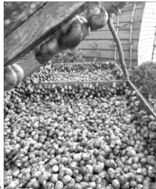
Pastiprina seksuālo uzbudinājumu. Vīngliemežu gaļa ir viegli sagremojama, vairo spēku un izturību. Tā ir spēcīgs afrodisiaks, kas pastiprina uzbudinājumu, tostarp arī seksuālo. Tieši šī iemesla dēļ vīngliemežus daudzās valstīs uzskata par izteiktu vīriešu ēdienu. 16. gadsimtā vīngliemežus audzēja mūki (interesanti gan!), jo gliemežu gaļu varēja ēst gavēnī.

– Sieva no dabas ir laba kulināre. Sākām eksperimentēt. Īstenībā tas ceļš bija ļoti ilgs, kamēr gliemeži varēja dabūt mutē. Neviens neko nepateica priekšā. Kur zvanām, tur neko nezina. Īstenībā tur ir viens knifīņš, līdz kuram mēs gājām četrus gadus. Lai gliemezis būtu ēdams, ar mīkstu konsistenci, ir jāpieliek kaut kas klāt. Kādreiz no mums restorāni dzīvus gliemežus ņēma, paši vārīja, gatavoja. Bet vienmēr mums zvanija, – ko tālāk?! Nu ko