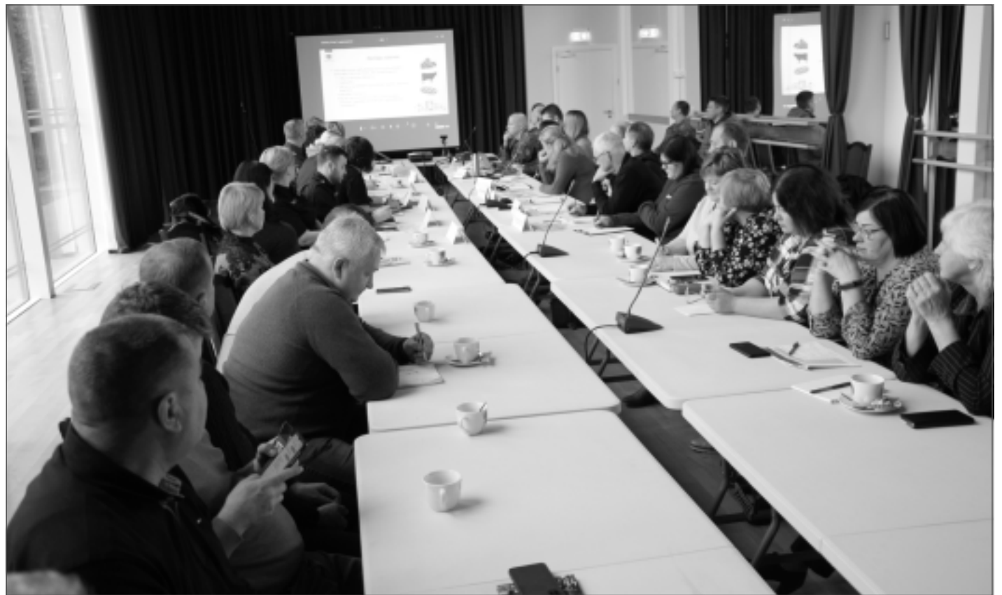
Mācības. Civilās aizsardzības mācības Balvos sākās pulksten 9 no rīta un ilga līdz pat pēcpusdienai. Mācību pirmajā daļā klātesošie iepazinās ar teorētisku informāciju, bet otrajā daļā ķērās klāt praktisku lietu apguvei.