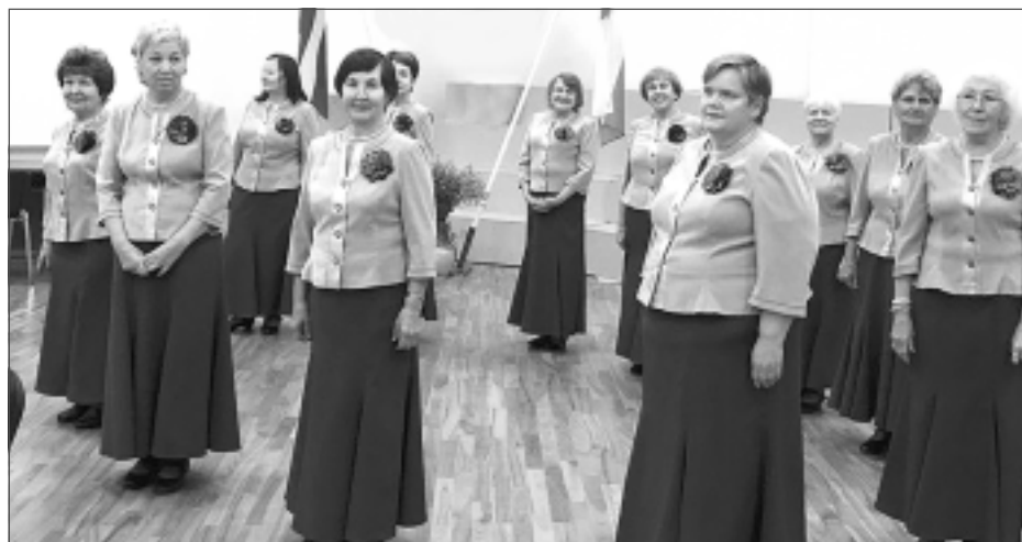
Iepriecina ar dejām. Rēzeknes kultūras nama senioru deju kopa “Zelta atvasara” iepriecināja gan ar skaistiem deju soļiem, gan tērpiem.