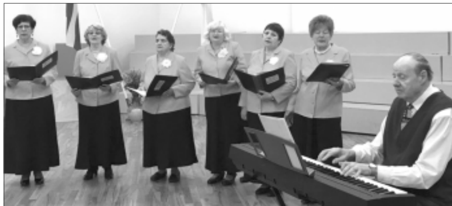
Muzikāls sveiciens. To klātesošajiem veltīja Rēzeknes pensionāru Dienas centra vokālais ansamblis “Zelta rudens”.