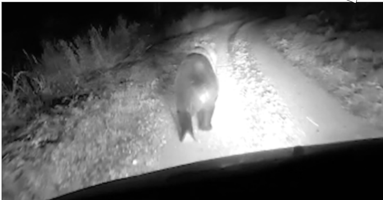
Lubāna mitrājs. Attēlā redzams lācis, kuru autovadītājs apzināti trenkāja Lubāna mitrāja apkārtnē.

Eksperti norāda, ka augusta beigās brūnie lāči Latvijā ir pilnībā atguvuši iepriekšējās ziemas guļas laikā zaudēto ķermeņa masu, turpina augt un sāk pastiprināti uzkrāt taukus nākamajai zīmai. Savukārt neraksturīgi augsta fiziskā slodze šo procesu var būtiski aizkavēt, kā arī provocē nepieciešamību atjaunot enerģijas rezerves, nodarot saimnieciskus postījumus, piemēram, izēdot medu no bišu stropiem. Lai arī nav pierādījumu video redzamā lāča