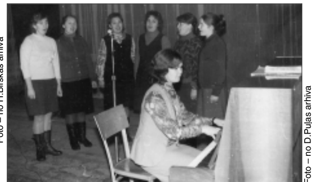
Svarīgi bija kultūras pasākumi. Kombināta sieviešu vokālais ansamblis mēģinājumā.