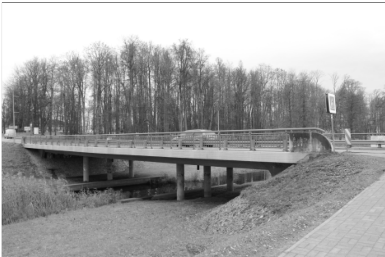
Neticami, bet fakts. Tilti pār Bolupi Balvos ir pašvaldības tilti, jo atrodas uz pašvaldības pārziņā nodotas tranzīta ielas.

Starp ļoti sliktiem un labiem tiltiem atrodas 16 pašvaldības tilti, kuru stāvokli var raksturot kā vidēju. Tie ir: Bahmatu tilts Baltinavas pagastā, Lācupes, Plitinavas tilti Balvu pagastā, Dziļāunes tilts Bērzpils pagastā, Kaupiņu un “Laimas” tilti Krišjāņu pagastā, Žogovas, Nemecku un Repkovas tilti Vecumu pagastā, Gāršas tilts Žiguru pagastā,