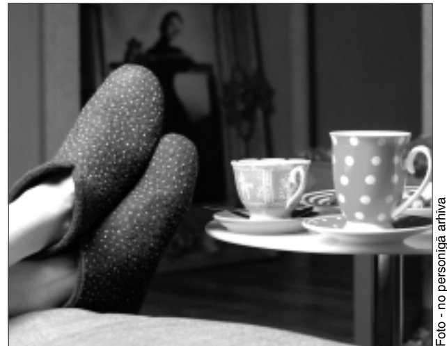
Kājām būs silti. Santas filcētajās čībās kājas nesals pat aukstā ziemā.