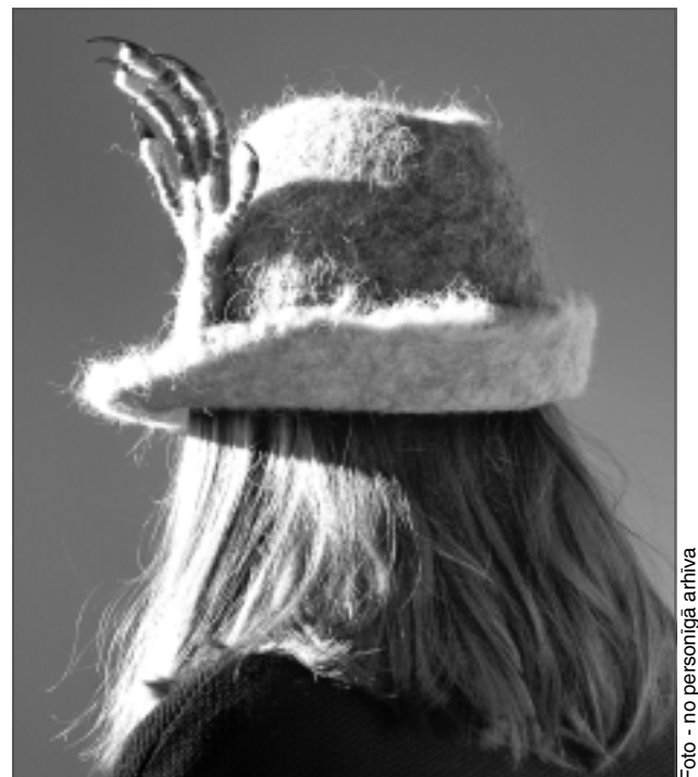
Filcēta cepure. Joka pēc tās rotājumam izvēlēta žurkas kāja Tima Bērtona animācijas filmas “The Nightmare Before Christmas” iespaidā.

*Utilitārisms – ētikas teorija, kuras pamatā ir doma, ka pareizais cilvēka rīcības veids ir tas, kas dod vislielāko ietekmi sabiedrības kopējās labklājības un laimes veidošanā.