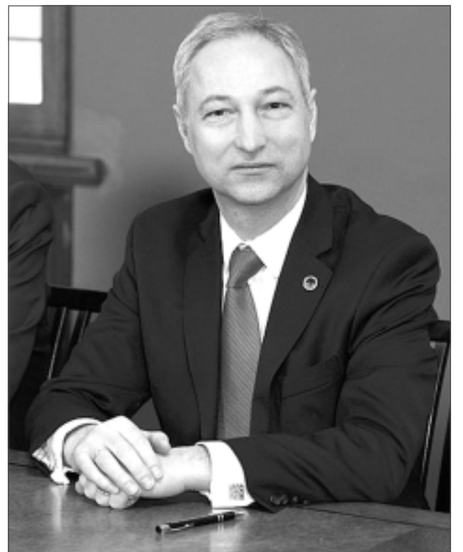
Publikāciju sagatavoja E.Gabranovs

Latgales iedzīvotāju ekonomiskās, sociālās un kultūras vajadzības. Es paļaujos uz Dievu, bet apzinos, ka arī mums pašiem (šeit, uz zemes) vēl diezgan daudz jāizdara, lai varam cerēt uz dažādu apstākļu sakrītību un veiksmes labvēlību. Atklāta saruna un godīga sadarbība ir daudzu durvju atslēga – ātrāk vai vēlāk vedoša uz rezultātu. Pats savulaik izvēlējos pēc studijām atgriezties un palikt uz dzīvi Latgalē, jo redzēju iespējas šeit īstenot savas idejas un gūt patiesu dzīves piepildījumu. Visur citur es būtu ciemiņš, šeit esmu mājās. Un tomēr laikam tikai ar gadiem aizvien vairāk apzinos savu atbildību senču un nākamo paaudžu priekšā. Neviens cits, tikai mēs paši, latgalieši, varam savu dzimto pusi izveidot par tādu, kurā pašiem prieks dzīvot un kurā mūsu jaunieši redzēs iespēju īstenot sevi, – jā, varbūt arī politiskajos procesos, kāpēc ne? Politika nav lamuvārds, bet gan sabiedrības spēja pieņemt kopīgus lēmumus. Ja to nespēsim, tad lamāsim paši sevi.