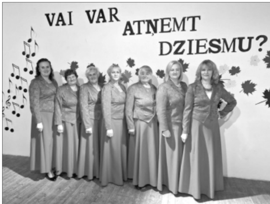
Drīz svinēs jubileju. Medņevas tautas nama sieviešu vokālais ansamblis "Melodija" nākamgad svinēs 20 gadu jubileju.