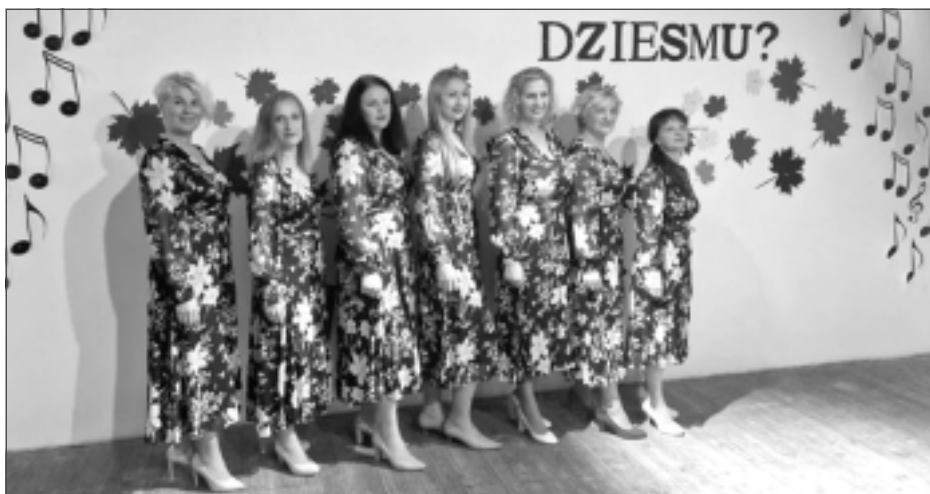
Strādā pie vērienīga projekta. Gulbenes novada Stradu pagasta sieviešu vokālais ansamblis "Pieskāriens" gatavo krāšņu un skanīgu izrādi ar dziesmām no teātra un kino repertuāra.

izveidojies pieradums laiku pavadīt mājās. Dienas ritms daudziem ir saspringts, un grūti atrast laiku mēģinājumiem. Šādi svētki ir ļoti vajadzīgi, manī vēl tagad viņu prieks pēc svētku kulminācijas – kopdziesmas "Cielaviņa". Jāzina, kā strādā, kādu repertuāru veido, kādi tērpi ir citiem kolektīviem ne tikai savā novadā, jo tas bagātina dalībniekus. Mums patika, ka sajūtāmie kā mazajos Dziesmu svētkos. Svētki jāriko, jāmeklē un jādzied arī kopīgas dziesmas." Viņa piebilst, ka dziedātājas aicina doties uzstāties arī uz citiem pagastiem, piemēram, jābrauc uz Brieciemu, taču traucē lielā aizņemība. 12.novembrī Medņevā būs vokālā ansambļa koncerts, veltīts valsts svētkiem. "Mācāmie