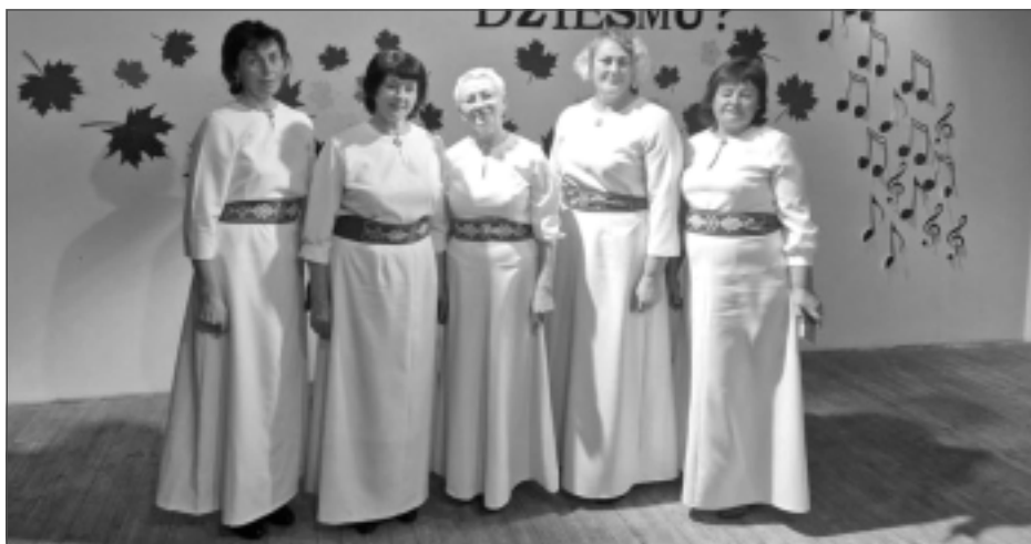
Piedalīsies skatē. Baltinavas sieviešu vokālais ansamblis "Naktsvijole" dosies uz skati Viļānos.