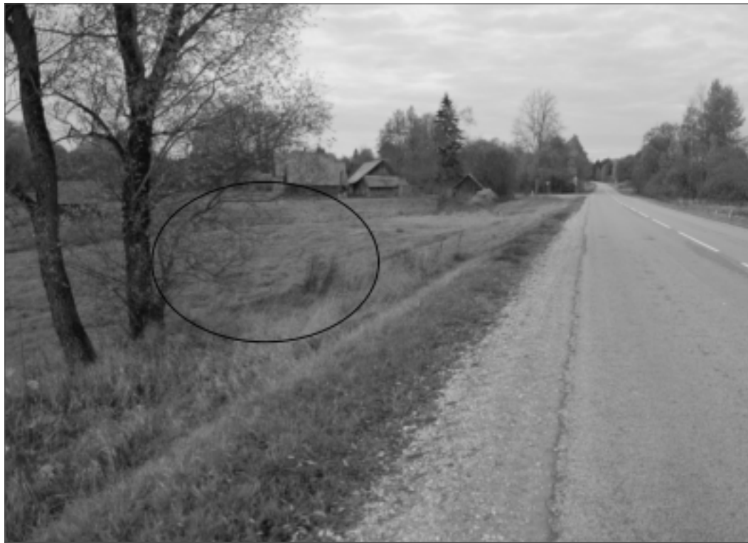
Negadījuma vieta. Pagājušās trešdienas pēcpusdienā Vectilžas pagasta Sudarbē šajā vietā, taisnā ceļa posmā, notika traģisks negadījums, kurā dzīvību zaudēja 52 gadus vecā pagasta iedzīvotāja. Par notikušo ierosināta krimināllieta, kas izskatīšanai nodota Valsts iekšējās drošības birojam.

Mēģinot aptvert notikušo un atgūties no pieredzētā, viņš joprojām stāvēja negadījuma vietā, kad pēc aptuveni 5-7 minūtēm piebrauca tā pati mašīna, kas nesen brauca garām. "Pasažiera pusē stikls bija sadragāts, to rotāja galvas lieluma caurums. No mašīnas izkāpa vīrietis, kuru uzreiz atpazīnu – tas bija Tilžas pagasta iedzīvotājs. Skatiens viņam neadekvāts – acis stiklainas, nedabiski bremzēts skatiens. Vīrietis jautāja, – kas te notika?"