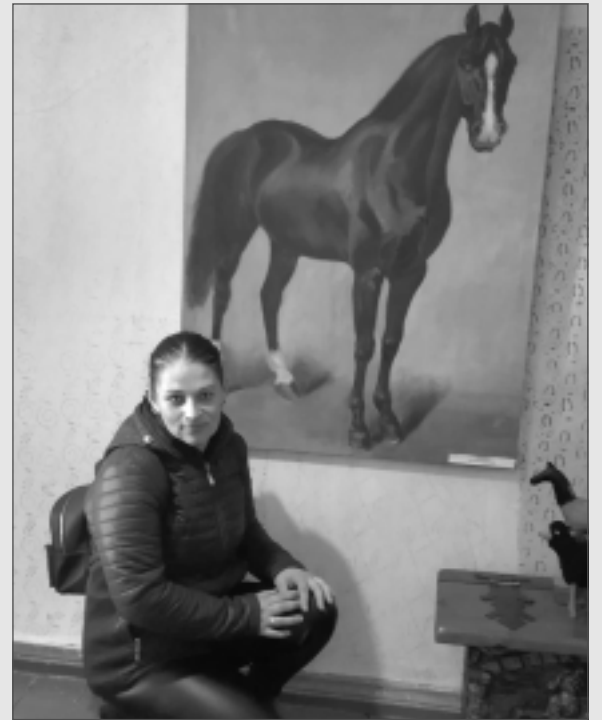
Foto un suvenīrs ar zirgu