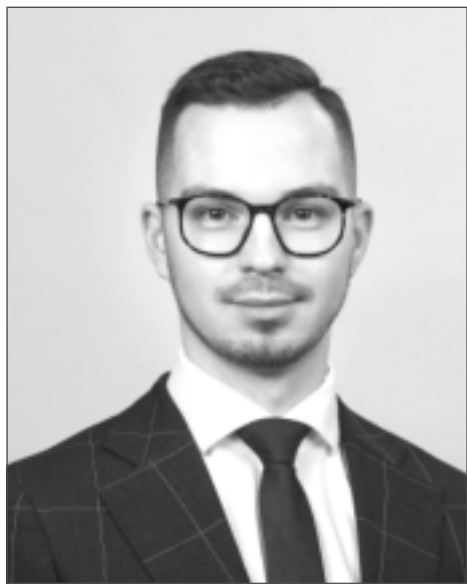
ARTŪRS TOMS PLEŠS, VARAM ministrs

VARAM pēdējo četru gadu laikā īstenojusi būtiskas reformas. Nedaudz vairāk nekā gadu pēc administratīvi teritoriālās reformas stāšanās spēkā noslēgusies vēl viena fundamentāla reforma – pašvaldību pārvaldības reforma. Jau iepriekš esmu uzsvēris, ka šī reforma iezīmē laikmeta un domāšanas maiņu. Kopš 1994.gada, kad pieņemts līdzšinējais likums “Par pašvaldībām”, notikušas būtiskas izmaiņas ne tikai valsts pārvaldē, bet arī pilsoniskajā sabiedrībā. Esmu gandarīts, ka Saeima atbalstījusi Vides aizsardzības un reģionālās attīstības ministrijas redzējumu, atbalstot laikmetīgu pārvaldību pašvaldībās.