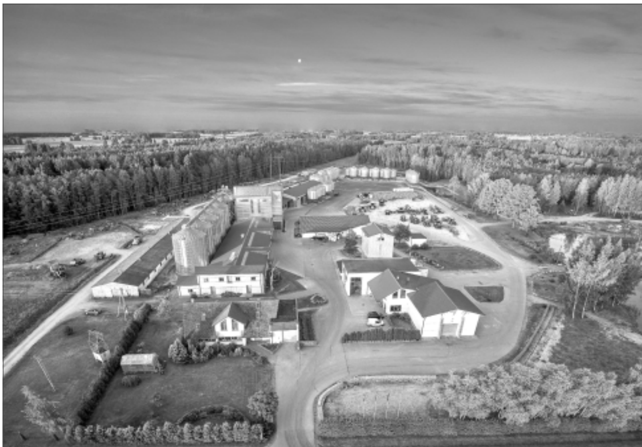
“Kotiņi” no putna lidojuma. Šīs zemnieku saimniecības pamatnodarbošanās ir graudkopība ar specializāciju sēklkopībā, turklāt “Kotiņi” ir vieni no lielākajiem sēklu ražotājiem Latvijā.

Kas ir inovācijas? Tā ir attīstība. Taču, lai kaut ko attīstītu, nepieciešams finansējums. “Kotiņos” attīstību mēra pēc vienas un tās pašas formulas. Jāpaņem A4 formāta lapa un uz tās jāuzliek viss business gada griezumā – izdevumi un ieņēmumi, bet, zem tiem novelkot stripu, jāskatās, kas palika atlikumā. Un tā gadu no gada. “Ja šajā lapā redzam minus zīmi, ir skaidrs, ka kaut kas jādomā savādāk. Bet ko mēs lauksaimniecībā varam izdomāt savādāk? Cilvēku, kuri strādā šajā sfērā, nav nemaz tik daudz. “Kotiņi” austrumu pierobežā saimnieko jau 30 gadus, un mēs saprotam, ka arī mūsu bērni grib dzīvot pietiekami brīvi. Un, lai to darītu, šajā A4 lapā starp ieņēmumiem un izdevumiem jābūt kaut kādam plusam. Ja šī plusa nav, bērni aizbrauc projām. Un tad jādomā, kā to plusu uztaisīt lielāku par minusu,” skaidro projektu koordinators. Kaut arī visas lielās kompānijas, kas saimniecībai piedāvā augu aizsardzības līdzekļus, minerālmēslus, tehnoloģijas, stāsta vienu, dabā notiek pavisam savādāk, jo visa pamatā ir bizness. Rolanda