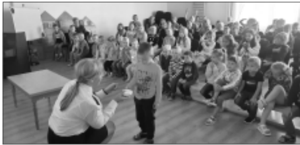
Atbild uz jautājumiem. Lai sniegtā informācija labāk paliktu atmiņā, VUGD pārstāvji iesaistīja bērnus zināšanu pārbaudes spēlēs.