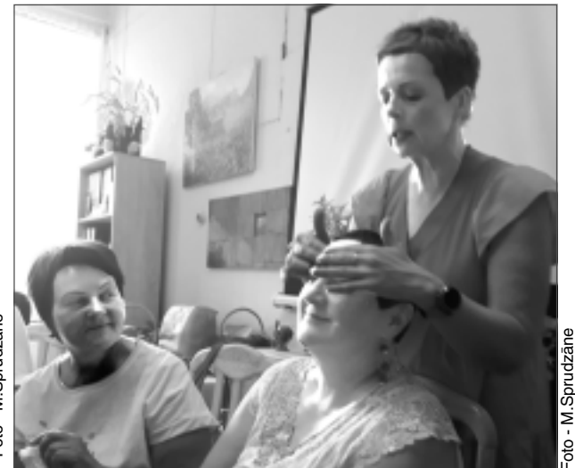
Ar praktisku ievirzi. Intas nodarbībā varēja izmēģināt sejas kopšanas līdzekļus, vērojot to pareizu pielietojumu.

noslēpumus, atklājot, kā var izrotāt tukšas garkaklainas pudeles vai citus stikla traukus, veidojot uz tiem krāsainu