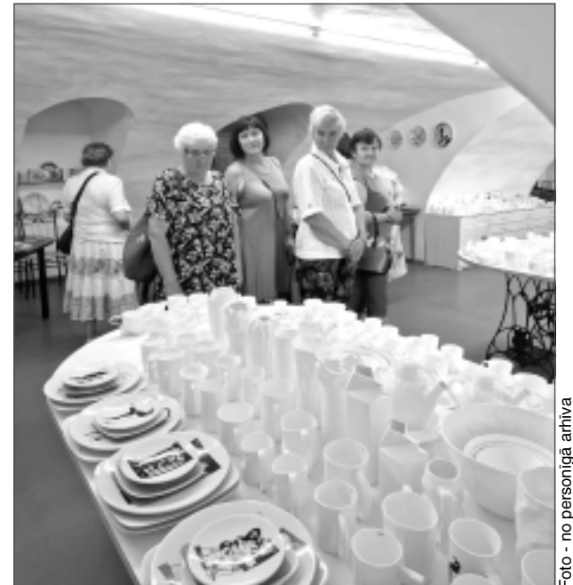
Porcelāna fabrikā. Porcelāns ir māksla un arī tūrisma objekts. Apmeklētāji var uzzināt traulslā porcelāna tapšanas noslēpumus.