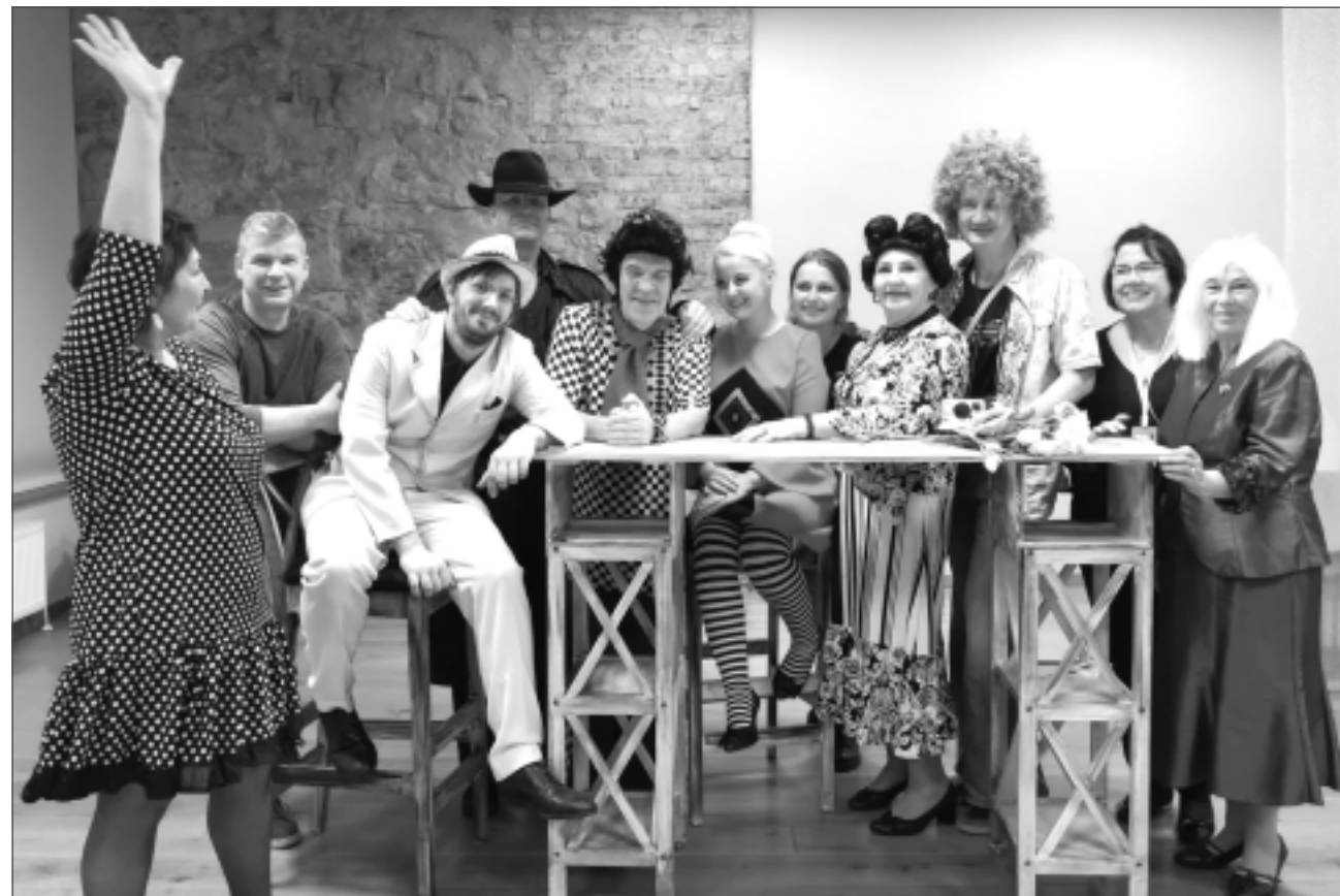
Kopā ar režisori. Skats no Cēsu teātra kamerizrādes "Kompanjoni".