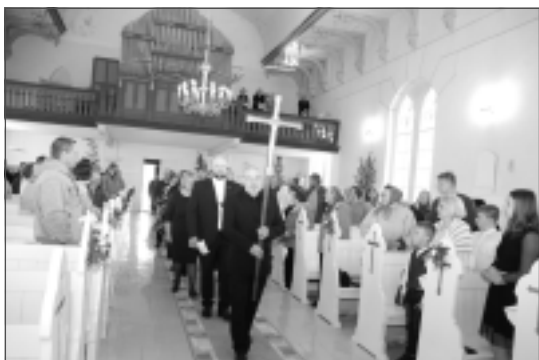
Vasarsvētkos. "Pa smuko," tā jaunās padomes ienākšanu baznīcā vērtēja draudzes locekļi.