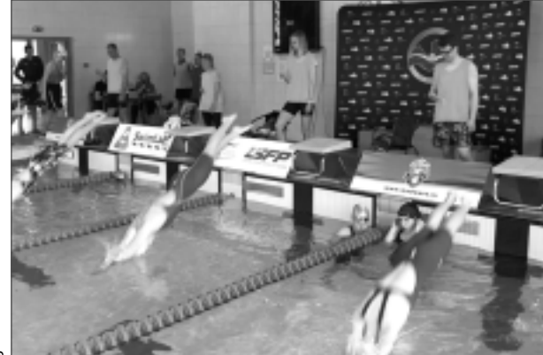
Starts dots! Sacensības Balvu peldbaseinā Latvijas stiprākie peldētāji novērtēja kā ļoti noorganizētu un veiksmīgu pasākumu.