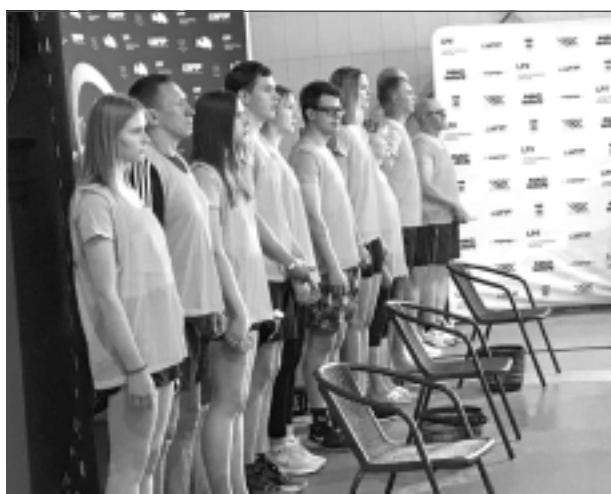
Tiesnešu komanda. Balvu peldbaseins uzņēma spēcīgākos Latvijas jaunos sportistus, un par sacensību veiksmīgu norisi rūpējās tiesnešu brigāde.