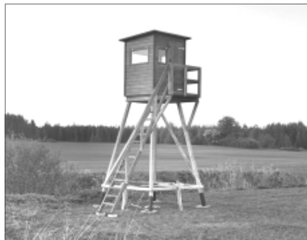
Novērošanas tornis. Iedzīvotājiem tie dos iespēju redzēt Balvu novadu no Sitas upes līdz Austrumu pierobežai.

Balvu novada pašvaldība ir pieņēmusi jaunus saistošos noteikumus "Par Balvu novada pašvaldības medību tiesību nomas piešķiršanas kārtību". Tika panākts, ka noteikumos paredzams šādu punktu – 17. Pašvaldība, atsavinot zemes vienību, par kuru ir noslēgts medību tiesību nomas līgums, 15 (piecpadsmit) dienu laikā informē medību kolektīvu, ar kuru ir līgums noslēgts. Pašvaldības noslēgtais medību tiesību nomas līgums ir saistošs jaunajam zemes vienības īpašniekam. Jaunajam zemes vienības īpašniekam ir tiesības līgumu grozīt vai lauzt, savstarpēji vienojoties ar medību tiesību nomnieku. Mednieki un kolektīvu vadītāji sapratīs, no kādiem riskiem šis nolikuma punkts viņus pasargā. Tādējādi ļoti ceru, ka neradīsies nepatīkami pārpratumi ar jaunajiem zemes īpašniekiem un Valsts meža dienesta institūcijām. Nomas līgumi tiek slēgti uz laiku līdz desmit gadiem. Katrā domes sēdē tiek apstiprināti pāris desmiti pašvaldības zemju atsavināšanas, respektīvi, pārdošanas darījumi, uz kuriem pašvaldībai ir bijis noslēgts medību nomas līgums ar kādu medību kolektīvu, tāpēc šādu nosacījumu iekļaušana ir svarīga. Ieteiktu mednieku robežkolektīviem izskatīt iespēju noslēgt savstarpējo medību platību robežlīgumu, kurā būtu iekļauti dažādi likumīgi iespējamie savstarpējās vienošanās punkti un būtu mazāks uztraukums par baltajiem laukiem. Balvu novadā ir 24 mednieku kolektīvi, precīzi dati par biedru skaitu man nav pieejami, bet aplēses