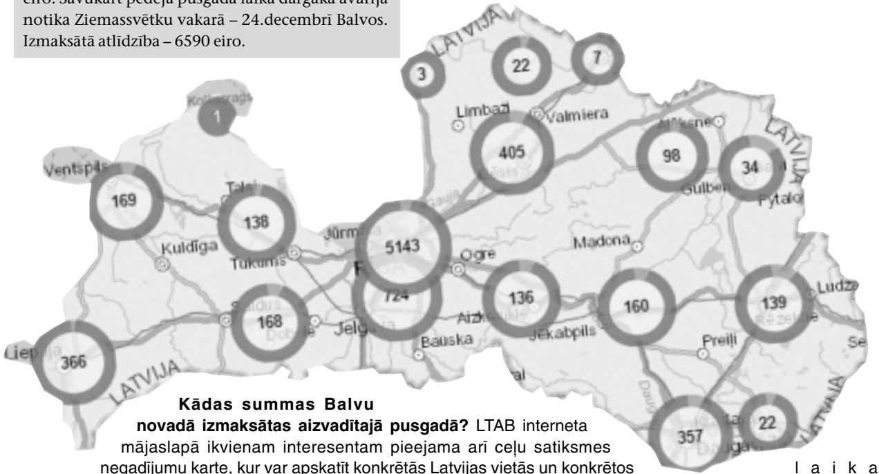
Kādas summas Balvu novadā izmaksātas aizvadītajā pusgadā? LTAB interneta mājaslapā ikvienam interesentam pieejama arī ceļu satiksmes negadījumu karte, kur var apskatīt konkrētās Latvijas vietās un konkrētos periodos notikušos ceļu satiksmes negadījumus un to rezultātā izmaksātās OCTA atlīdzības.

Tā pagājušajā gadā apdrošināšanas sabiedrības un LTAB atlīdzībās kopumā izmaksāja 54,25 miljonus eiro. Savukārt bijušajos Balvu, Viļakas, Rugāju un Baltinavas novados pērn pieņemti lēmumi par OCTA atlīdzību izmaksu par kopējo summu 219 654 eiro. Visvairāk – Balvu novadā (181 414 39 eiro), pēc kā sekoja Rugāju novads – 29 055 16 eiro, Viļakas novads – 6 585 24 eiro un Baltinavas novads – 2 599 71 eiro. Par vairākiem negadījumiem izmaksātā OCTA atlīdzība bija virs 10 000 eiro, bet vislielākā izmaksātā summa pērn mūšpusē bija Rugāju novadā – 25 238 16 eiro.