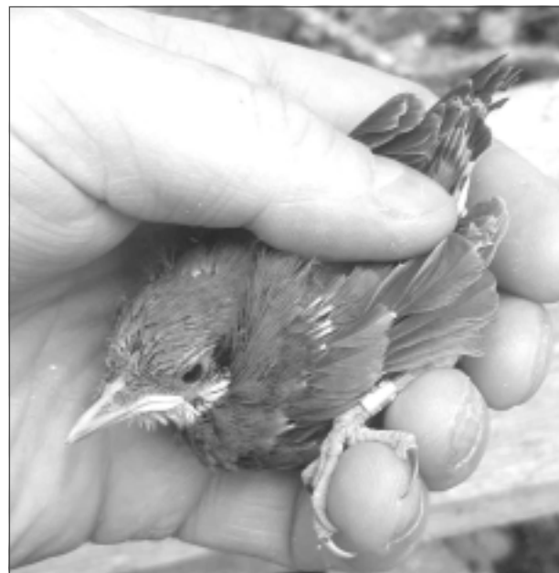
Apgredzenots dziļnītis. Dziļnītis pieder pie zvirbulveidīgajiem putniem – dziļnīšu dzimtas – un ir vienīgais pārstāvis šajā dzimtā Latvijā.

Putnu ķeršana notiek ar speciāliem putnu ķeramajiem tīkliem. Ja putnus gredzeno būrīšos, tad var iztikt bez tikla. Ar tīklu ķer jau pieaugušos putnus. Veicot putnu gredzenošana, tiek ievēroti visi putnu saudzējoši noteikumi. Uzliekot putnam attiecīgi paredzēto gredzenu, tas netraucē pilnvērtīgi dzīvot. Pēc apgredzenošanas putni tiek palaisti. Kas ar viņiem notiek pēc tam? Viņi turpina savu ikdienas dzīvi, tikai šoreiz ar gredzenu. Kādēļ gredzeno putnu? Lai noskaidrotu dzīves ilgumu, pētītu migrāciju, lai zinātu, cik stipri putns ir piesaistīts