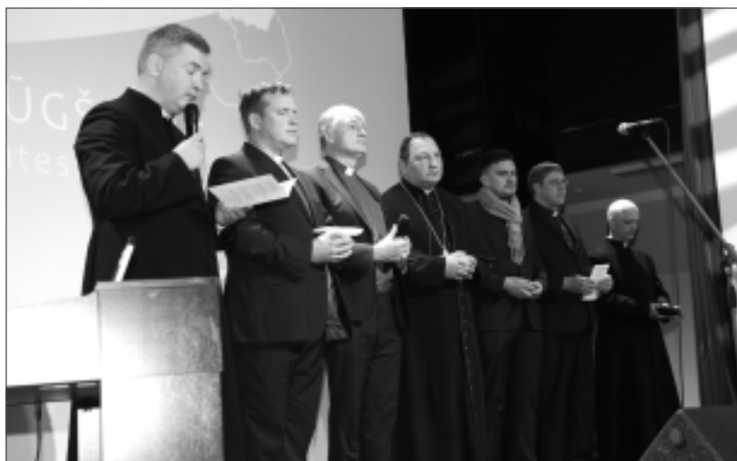
Vienojas lūgšanā. Pasākuma izskaņā visi klātesošie garīdznieki lūdās par iedzīvotāju garīgo un materiālo labklājību, par vienaldzīgajiem ticībā, lai cilvēki atvērtu savas sirdis uz Svētā gara žēlastību, lūdās par ģimenēm un bērniem, par vienotību cilvēku starpā, mieru un tēvzemes mīlestību, darba tikumu, svētību zemei un mieru kaimiņu valstīs. Garīdznieki lūdza par tiem, kam šobrīd ir grūtības, par lauksaimniekiem un bagātīgu ražu, par dzimteni un tautu, par vecākiem un vecvecākiem, kā arī mūžībā aizgājušajiem.

brīdim, kad aizdomājās par Dievu, Aigu nemocija sirdsapziņa par veiktajiem abortiem. Bet kādā dienā pēc smagas darba dienas viņa savā sirdī sadzirdēja Dieva bausli "Tev nebūs nokaut": "Tas mani rezonēja tik ļoti, ka apstājos ceļa malā un ilgi raudāju, nožēloju visus abortus, ko biju veikusi šīm sievietēm." Viņa saprata, ka Dievam svarīga katra, pat vēl nedzimuša cilvēka dzīvība. Pēc mokošām pārdomām jaunā ārste pameta darbu, kas sniedza lieliskas karjeras iespējas. Bet drīz vien jaunā mediķe saņēma vēl vienu Dieva sniegtu iespēju – piedāvājumu strādāt Valmieras slimnīcā par nodaļas vadītāju. "No tā laika sākās mana īstā, patiesā karjera ar Dievu, un šobrīd visa mana dzīve veltīta, lai nosargātu cilvēka dzīvību," teica mediķe.