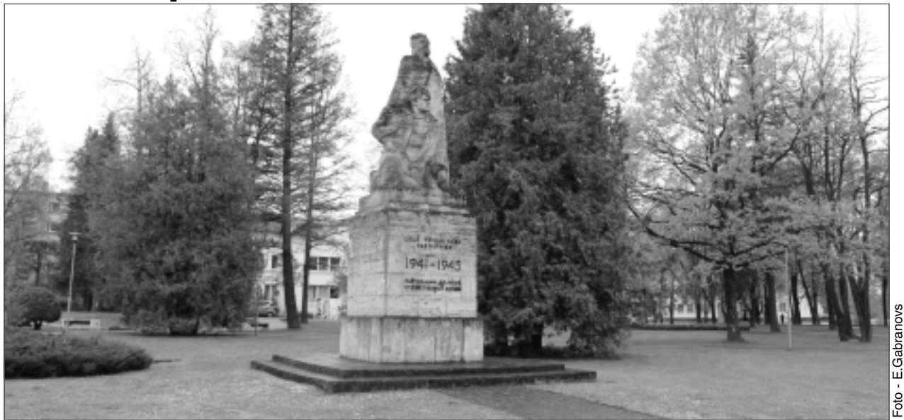
Balvu skvērā. Šūnakmenī veidotais piemineklis partizāniem, kas cīnījies pret vācu iebrucējiem Lielā Tēvijas kara laikā (1941 -1945), kā Otro pasaules karu dēvē Krievijā, Balvos tika atklāts 1961.gada 11.jūnijā. 2004.gadā ar pilsētas domes gādību atjaunoja pieminekļa pamatus, bet 2006.gada rudenī "San – Tex" strādnieki notīrīja sūnas no pieminekļa.