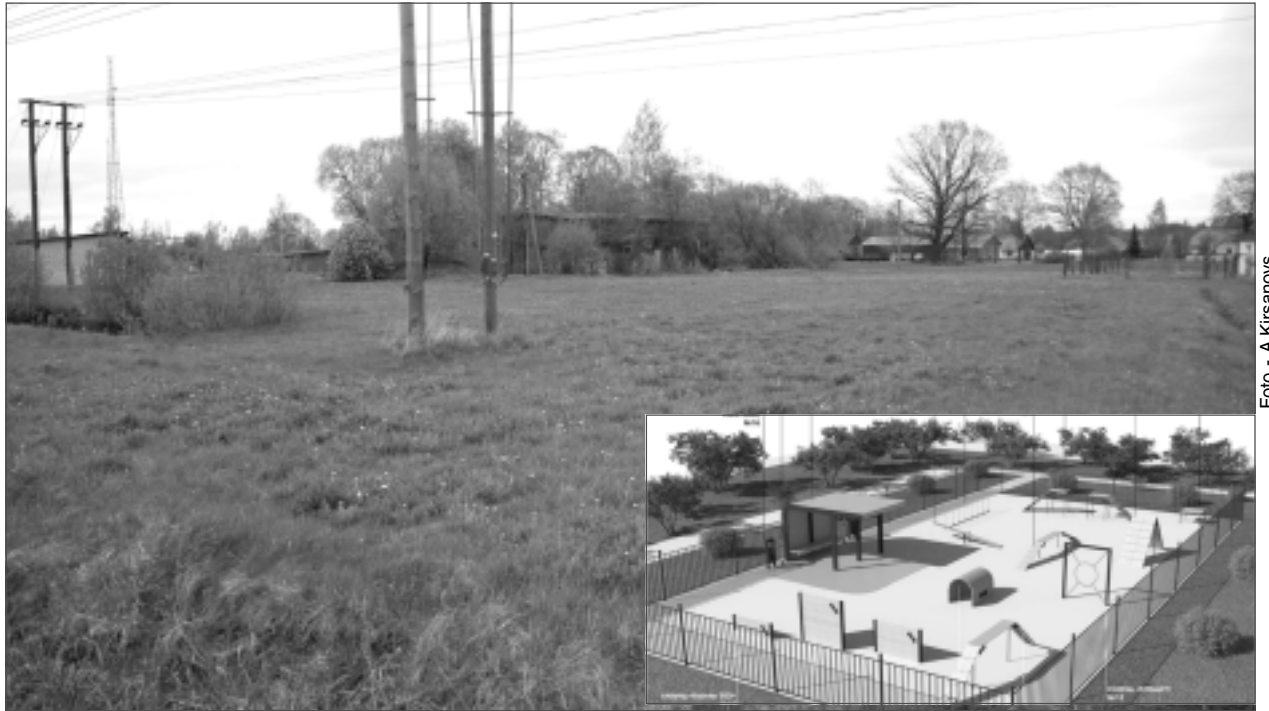
Tāda būs “Vilku ieleja”. Pašvaldība nolēma Ikaram Bleivam nodot nomā uz septiņiem gadiem zemes vienību Brīvības ielā 127B, Balvos, 4168 m 2 platībā suņu pastaigu un treniņu laukuma izveidošanai. Plānots, ka treniņus darinās SIA “Timber Kit”.

Savukārt pieredzējušais kinologs OĻEGS ALEKSEJEVS apgalvoja, ka labprāt vadīs suņu apmācību treniņus jaunajā laukumā: “Savu iespēju robežās palīdzēšu. Cerēsim, ka kovids un visas nebūšanas tuvojas beigām. Iedzīvotāju interese ir liela. Vienīgi gribētos vēl lielāku atbalstu no pašvaldības. Sākt ir viens, bet vēlāk, rīkojot aktivitātes, šis atbalsts, kaut vai informatīvs, būs īpaši nepieciešams,” atgādināja kinologs.