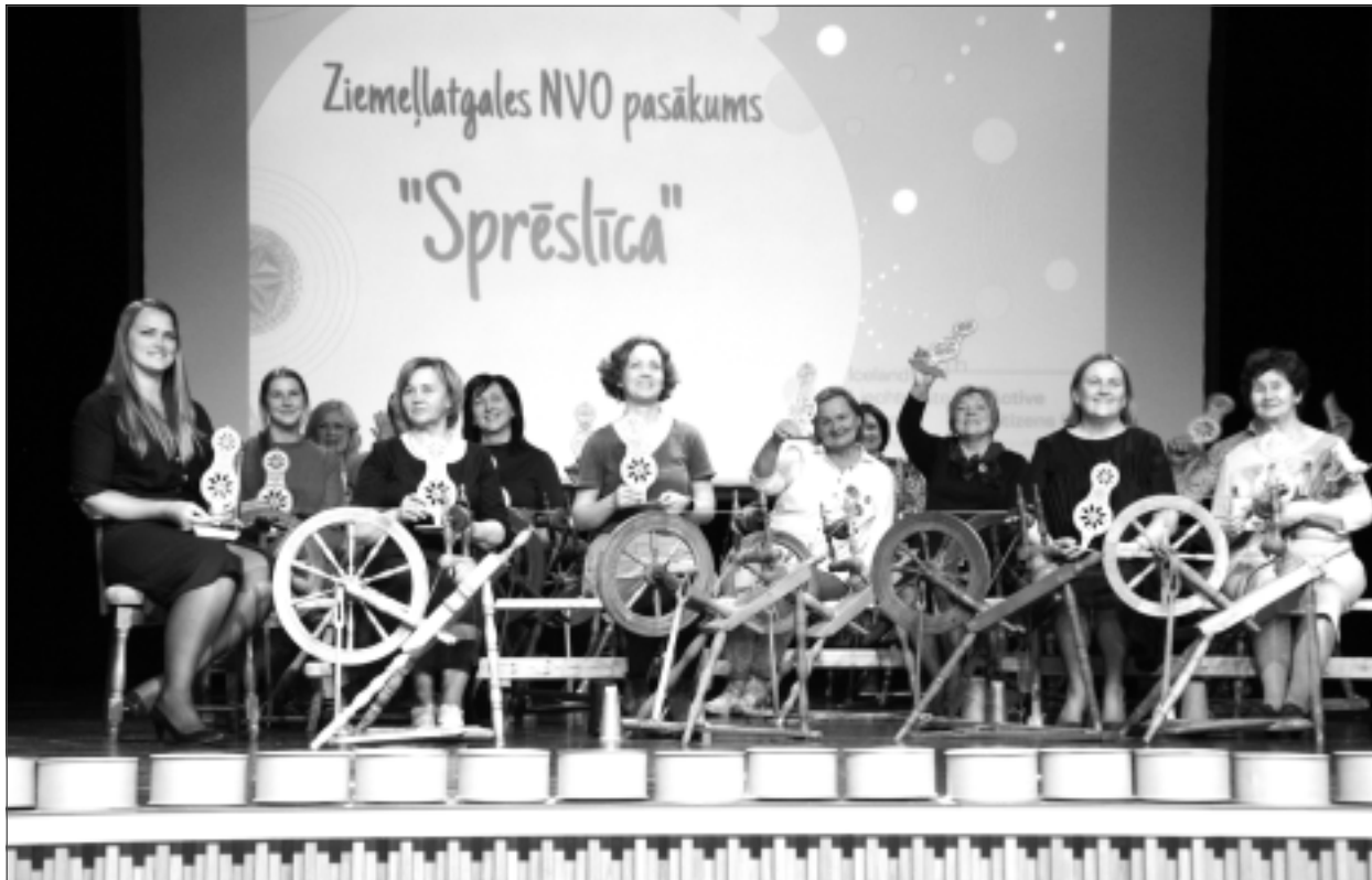
Gada balvas saņēmēji. Pirms svinīgās ceremonijas pie vērpjamajiem ratiņiem uz Balvu Kultūras un atpūtas centra skatuves darbojās rokdarbnieces no biedrības “Mežģis”, svinīgās ceremonijas turpinājumā vietas pamazām aizpildīja precīgie balvu saņēmēji.

Speciālbilvas saņēma: par novada tēla spodrināšanu – motoklubs “SPIEĶI VĒJĀ”, par starpkultūru dialoga uzturēšanu – biedrība “RAZDOĻJE”, kā arī neregistrētā interešu grupa “OLĪVES”.