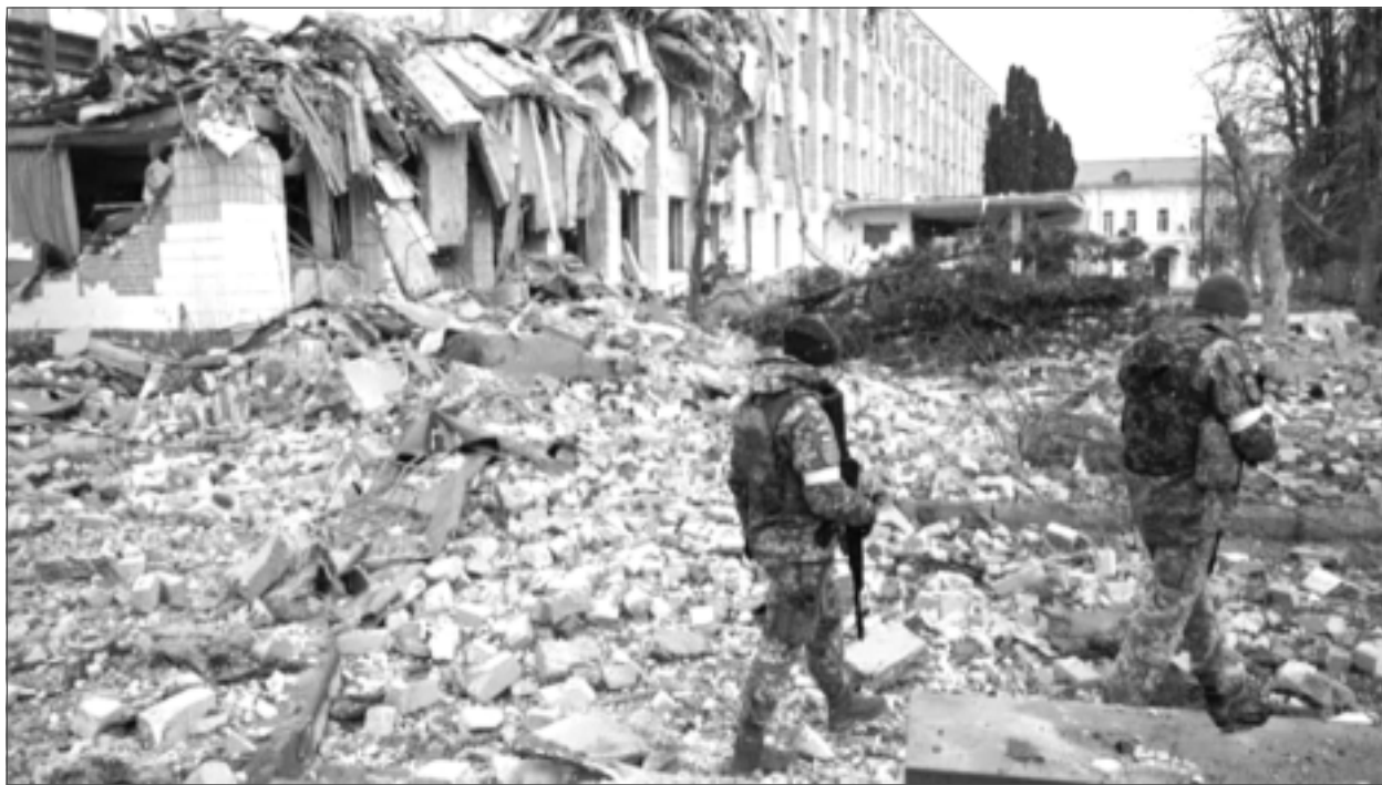
Izpostīta līdz nepazīšanai. Daudzstāvu mājas, iestādes, veikali – gandrīz visa Mariupole pārvērtusies lielās drupu kaudzēs. Taču, neskatoties uz to, tur joprojām uzturas daudz civiliedzīvotāju, kuriem nepieciešama palīdzība.