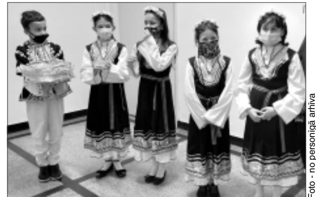
Uzņem bulgāru skolēni. Viesus sagaidīja bulgāru skolēni nacionālajos tērpos un ar sālsmaizi.