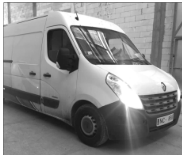
Dāvana. Šis mikroautobuss ar pirmo palīdzības sūtījumu devās uz Ukrainu un tur arī palika. Tā bija latviešu dāvana ukraiņiem.

2008.gadā. Paldies Dievam un Vairai Viķei-Freibergai, ka mēs esam Eiropā un dzīvojam NATO aizsardzībā. Kāpēc esmu par Ukrainu? Tāpēc, ka negribu piedzīvot brīdi, kad, izejot uz ielas ar plakātu “Karam – nē!”, mani aizturēs, kā tas notiek Krievijā, negribu, lai 20 gadus ir viens un tas pats prezidents. Es to visu negribu, jo TUR mēs jau esam bijuši...”