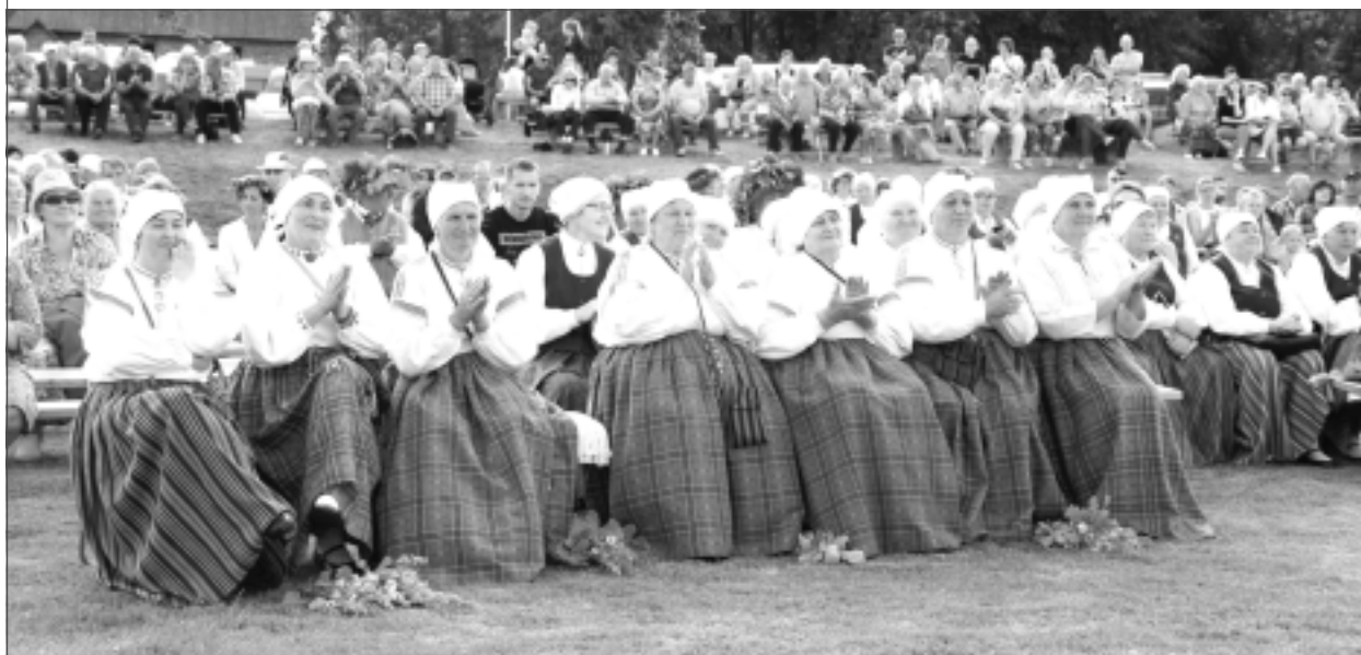
"Baltica 2018". Iesūtīja Pēteris no Balvu novada.

Katra mēneša labākās fotogrāfijas autors saņems balvu. Fotogrāfijas var iesūtīt pa pastu – Balvi, Teātra ielā 8, LV-4501, vai elektroniski – vaduguns@apollo.lv. Pie foto obligāti norādāms vārds, uzvārds (vēlams - tālrunis).