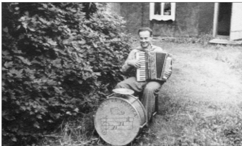
Brīvbrīdi sagatavoja I.Zinkovska