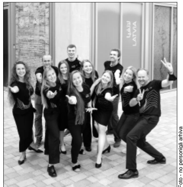
Kopā ar komandu. Latvijas komandas dalībnieku darbs ir daudzveidīgs, bet galvenais viņu uzdevums – iepazīstināt apmeklētājus ar savu valsti.