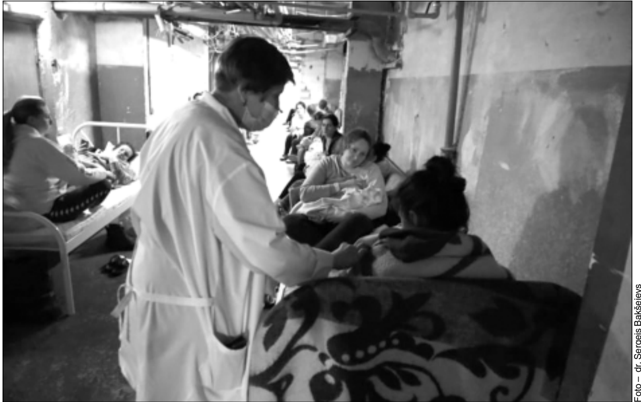
Mirkļis no ikdienas apgaitas. Periodu pirms un pēc dzemdībām jaunās māmiņas pavada slimnīcas pagrabstāvā, kurā izvietotas gan gultas, gan vajadzīgais aprīkojums. Tur visi jūtas drošāk.

Ja ik pēc brīža nedzirdētu apkārt dārdošos šāvienu un par