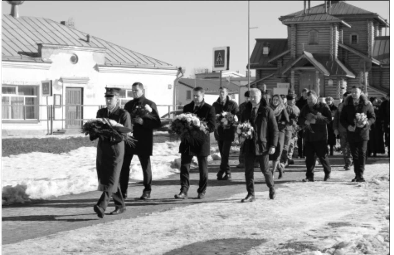
Dodas pie tautā sauktā "Staņislava". 2.marta pasākumi Balvos iesākās ar ziedu nolikšanu pie pieminekļa, kas 2021.gada 28.septembrī nostājās savā vietā jau ceturto reizi.

Pierakstīts ielā, kurai nav mainīts nosaukums. Pirms ziedu nolikšanas pie pieminekļa Latgales pulka kritašajiem karavīriem tieslietu ministrs Jānis Bordāns (foto – no labās) atklāja, ka pirmā adrese, kurā pierakstīts, ir Brīvības iela Balvos, kas vēstures griežos nekad nav mainījusi nosaukumu: "Izrādās, ka otra pilsēta Latvijā ir Dobeles, kurā okupācijas laikā ielas nosaukums nepārtapa ne par Ļeņina, ne pat par Rīgas ielu. Mums vajag atcerēties, ka šodien ir svinama diena. Šis datums izvēlēts jūsu – balviešu, vectēvu un vecmammu – godam, kuri karoja šajā dienā. Jāatceras šis uzvarētāju gars. Miers bija, ir un būs Latvijā. Vajag justies drošiem un uzturēt šo drošo garu. Par ko šajās dienās ir jāpadomā? Par savu māju, par savu ģimeni, par savu valsti. Dzīvē nav laika izlaisties vai atslābināties kādu brīdi. Gūt prieku var no tā, ka esi čakls un rūpējies par savu māju, tautu un zemi. Tad būs arī pārticība. Karu neizraisījām nedz mēs, nedz mūsu sabiedrotie. Mēs esam drošajā pusē. Mēs iesaistīsimies Ukrainas atjaunošanā. Paies kāds laiks, un mēs to atcerēsimies kā murgu. Ja šobrīd paraugāties uz Ukrainu, tad neērti un kauns teikt: "Vai, vai, cik mums ir slikti!" Kas dzīvē ir vissvarīgākais? Drošība! Būsim viens pret otru iecietīgi – nevis satrauksimies, bet iedrošināsim viens otru."