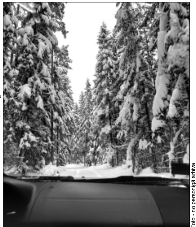
Mežs ziemā. Esmeraldai ļoti patīk fotografēt dabu, ietērptu ziemas rotā. Kas gan var būt vēl skaistāks, kā mirdzošas sarmas klāti koki vai baltā segenē ietinušās egles?!