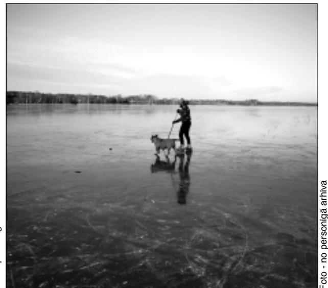
Kad ledus saplūst ar debesīm. Ance fotografētais aizsalušā ezera skats visefektīvāk izskatās krāsains, kad redzams, kā žilbinošais ledus zilums sacenšas ar bezgalīgo debesu zilgmi.