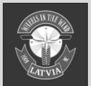
Motokluba “Spieķi vējā” emblēma