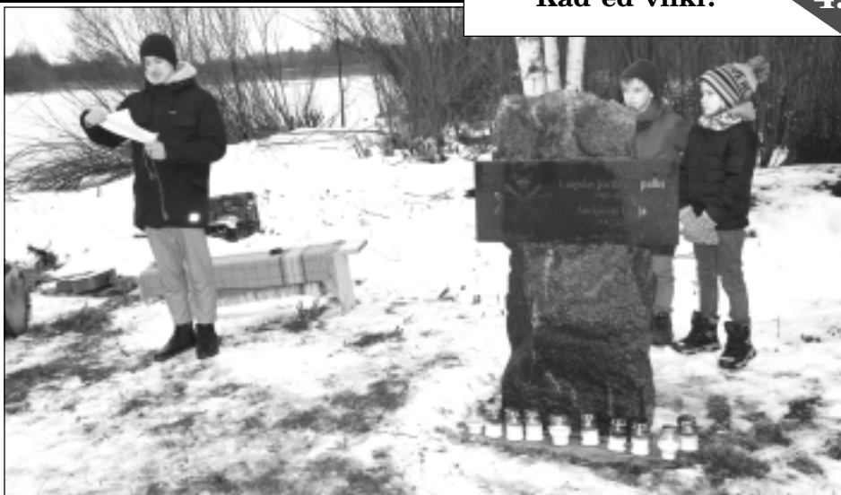
Kapsulu iemūrē trīs brāļi. 2020.gada 9.janvārī Valsts prezidents Egils Levits, viesojoties Upītē, parakstīja vēstījumu nākamajām paaudzēm, ko vakar Andra Slišāna trīs dēli (foto) iemūrēja jaunās piemiņas zīmes pamatos.