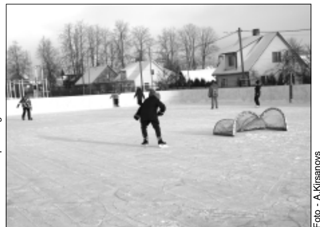
Balvu slidotavā. Pilsētas slidotavu iecienījuši bērni, kuriem šī bija laba iespēja aktīvi atpūsties skolas brīvlaikā.