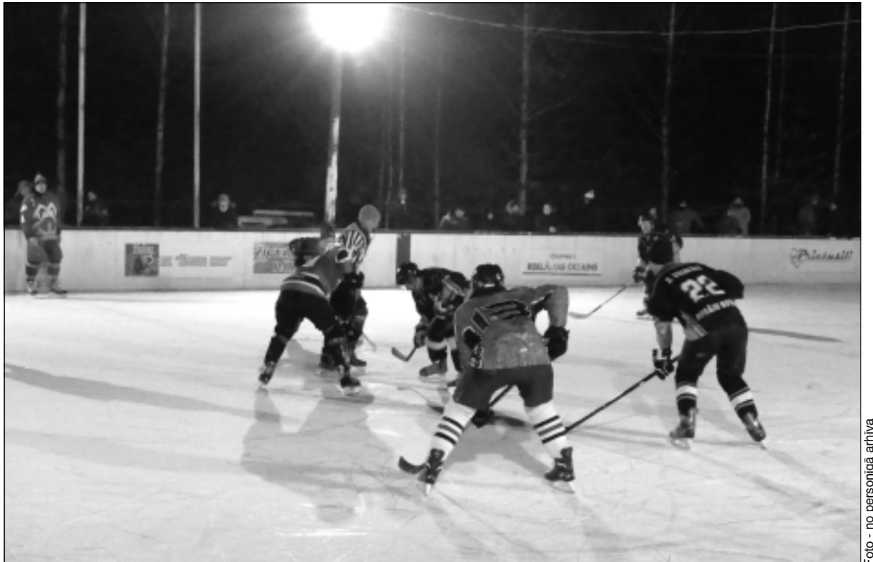
Noilgojušies pēc adrenalīna. Spēlētājus ar skaļiem saucieniem uzmundrināja līdzjutēji. Viss liecināja par to, cik ļoti šī sporta veida entuziasti noilgojušies pēc sajūtām, ko spēj sniegt tikai istas sacensības.

Slidotavā aizliegts smēķēt, lietot apreibinošas vielas, kā arī atrasties to ietekmē, ievest dzīvniekus, lietot necenzētus vārdus un fiziski aizskart citas personas, bojāt aprīkojumu, ienest citu personu veselību apdraudošus priekšmetus un vielas, uzturēties uz ledus ar mehānizētiem transporta līdzekļiem, velosipēdiem, skrituļslidām, skrituļdēļiem, bērnu ratiņiem u.c. pārvietošanās