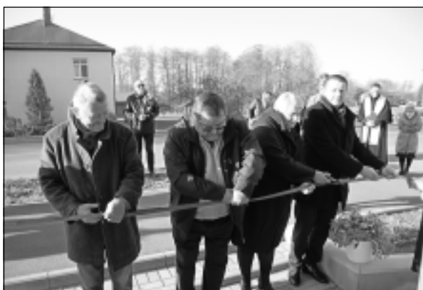
12.oktobris. Viļakā svinīgi atklāja ēkas Abrenes ielā 9 un Balvu ielā 10 (aprūpes centru un dzīvokļu māju).

Ar izcīnīto 1.vietu un ceļojošo "Sudraba katlu" no publiskā sektora komandu sacensībām, kas 1.oktobrī notika Rīgā, atgriezās Rugāju vidusskolas pavāres. 4.oktobrī, strauji pieaugot Covid-19 vīrusinfekcijas hospitalizēto (stacionēto) pacientu skaitam, Balvos atvēra Covid-19 nodaļu ar 14 gultasvietām. 8.oktobrī Balvu Kultūras un atpūtas centrā svinīgā pasākumā godināja mūspuses pedagogus, bet 9.oktobrī Balvu pilsētas parkā pie estrādes pulcējās sportisti un citi interesenti, lai izmēģinātu spēkus skrējienā un nūjošanā apkārt Balvu ezeram. 11.oktobrī ar varoņdarbiem izcēlās kāda jauniešu grupa, kura izsita logus vismaz četrām Balvos esošām ēkām. 14.oktobrī Viļakas pareizticīgo draudze svinēja baznīcas 30 gadu atjaunošanas jubileju un 150 gadu jubileju, kopš tā tika uzcelta. 16.oktobrī Krišjāņos uzstādīja vides objektu "Krišjāņu Staburags", bet pāris dienas vēlāk Balvos atklāja ģimeņu un aktīvā dzīvesveida telpas "Kureti cafe". Oktobrī Zemessardzes 3.Latgales brigādes karavīri un zemessargi Kāpessila kapsētā Tilžas pagastā, pulkveža Jāņa Žagatas atdusas vietā, uzstādīja pelēkā granītā kalnu pieminekli.