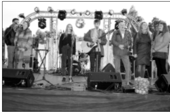
18.septembris. Šķilbēnu pagastā aizvadījām senāko latgaliešu mīlas, dzejas un dziesmu festivālu "Upītes Uobeļduorzs".