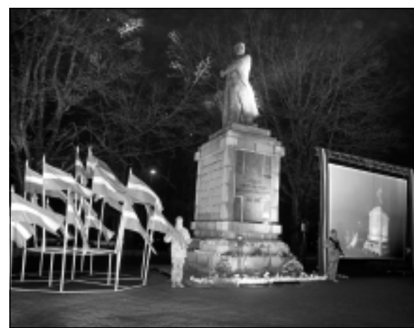
11.novembris. Latgales partizānu pulka kritušajiem karavīriem veltītais piemineklis, tautā sauktais "Staņislavs", atgriezās savā vietā nu jau ceturto reizi.