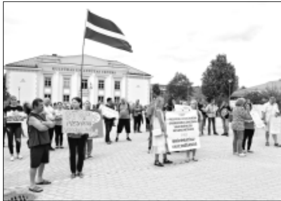
14.augusts. Balvu Kultūras un atpūtas centra laukumā pulcējās piecdesmit cilvēku domubiedru grupa, kura iestājās pret piespiedu vakcināciju.