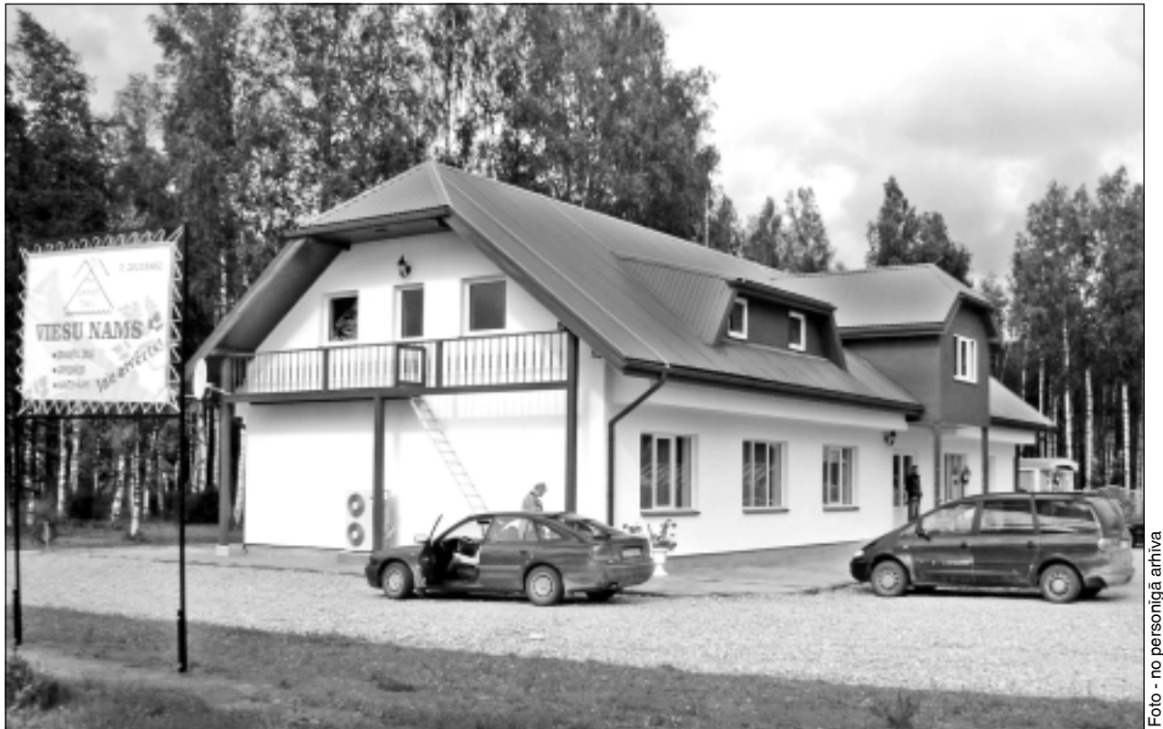
Atrodas skaistā vietā. Senioru viesu nams, ko atvērusi sabiedrība ar ierobežotu atbildību “Pa laimes taku”, atrodas skaistā vietā, divu upju un bērzu birzs ielokā. Tieši pretī atrodas Lejasciema estrāde, bet netālu – Tirzas upe.