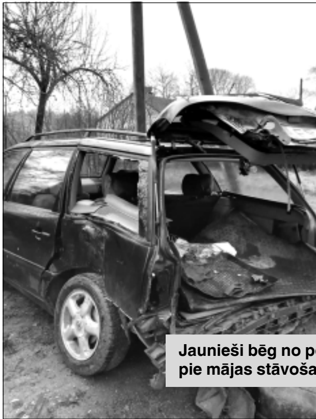
Jaunieši bēg no policijas un sasit pie mājas stāvošas mašīnas

Tās pašas dienas ritā, kad notika avārija (17.novembrī), vīrietis ar iesniegumu vērsās apdrošināšanas kompānijas “Gjensidige” Balvu filiālē, lai varētu saņemt zaudējumu atlīdzību par sabojātajām automašīnām. Tomēr Bērzkalnes pagasta iedzīvotājs atkal saskārās ar nepatīkamu pieredzi, jo, pirmkārt, tehniskais eksperts, kurš novērtētu mašīnām radītos bojājumus, bija jāgaida divas nedēļas. Otrkārt, noteikumi paredz, ka personām, kas pretendē uz zaudējumu atlīdzību, ir pienākums saglabāt transportlīdzekli un bojāto mantu tādā stāvoklī, kādā tā bija pēc ceļu satiksmes negadījuma. Tā nepieciešams rīkoties līdz laikam, kad to likumā noteiktajā kārtībā apskatīs eksperts, vai arī līdz laikam, kad tiek saņemts atteikums veikt apskati. Rezultātā, vienkārši runājot, pie mājas turpmākās divas nedēļas bija jāpaglabā viss tas bardaks ar sasistajām mašīnām un salauzto sētu, līdz ieradīsies eksperts. “No mājas priekšas nevarēju aizvērt vai normāli novietot, sakārtot mašīnas. Salauzto sētu taisīt nevarēju, jo pateica to neaiztikt. Ar vienu no mašīnām, kura pēc negadījuma ir