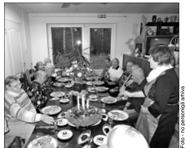
Pie kopīga galda. Gan jubilejas, gan valsts un gadskārtu ieražu svētkus seniori svin pie kopīga galda, kur vieta sarunām, jokiem un smiekliem. Viesu namā dzīvo arī kāda vietējā māksliniece, kura parūpējas par svētku galda noformējumu, uzzīmē skaistas galda kartītes.