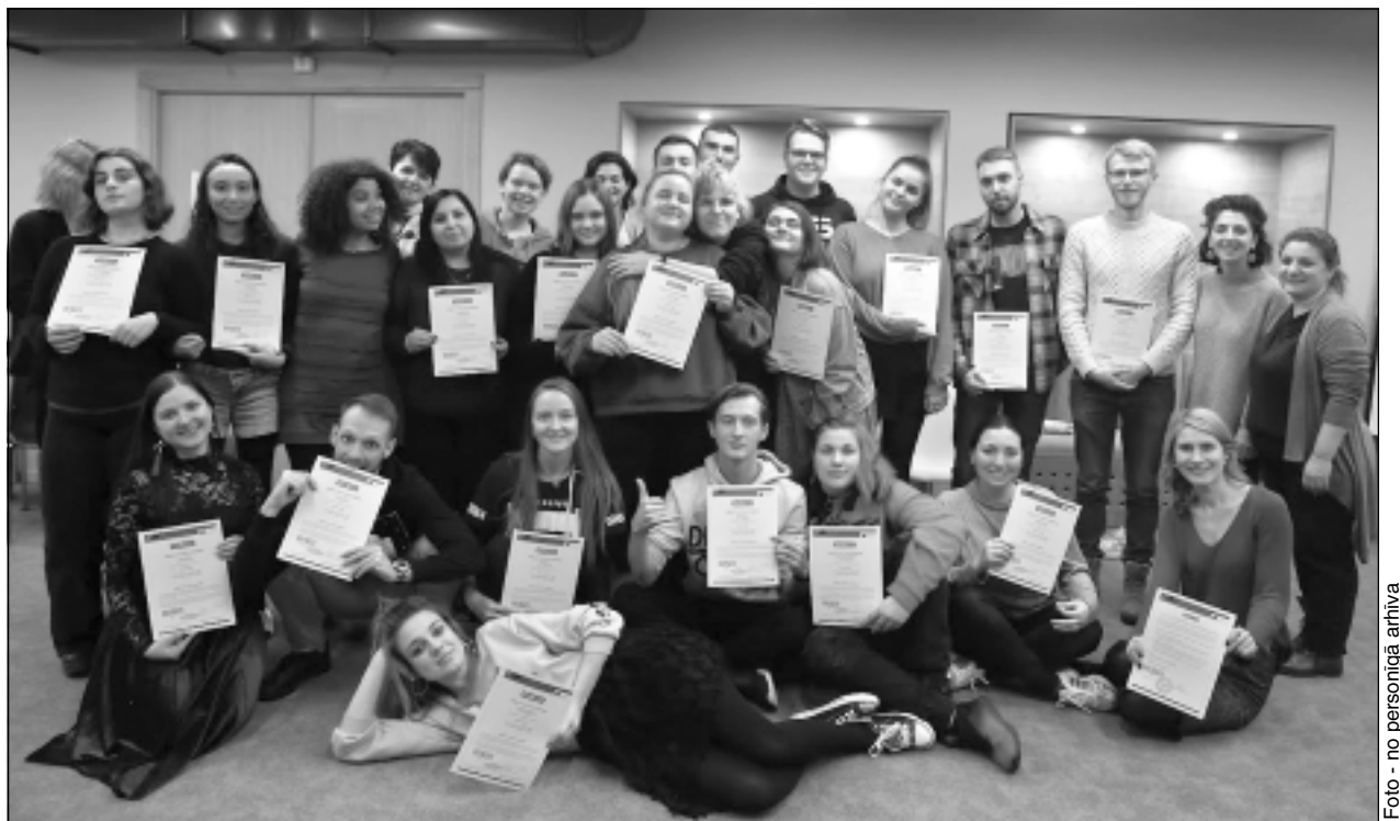
Seminārs noslēdzies, bet sadarbība turpināsies. Viesojoties Armēnijā, Latvijas pārstāves ieguva daudz jaunu paziņu un dibināja kontaktus sadarbībai nākotnē. Viņas uzsvēra, ka ir ārkārtīgi būtiski izjust saikni ar citiem Eiropas jauniešiem un pārzināt jaunākās tendences darbā ar jaunatni.