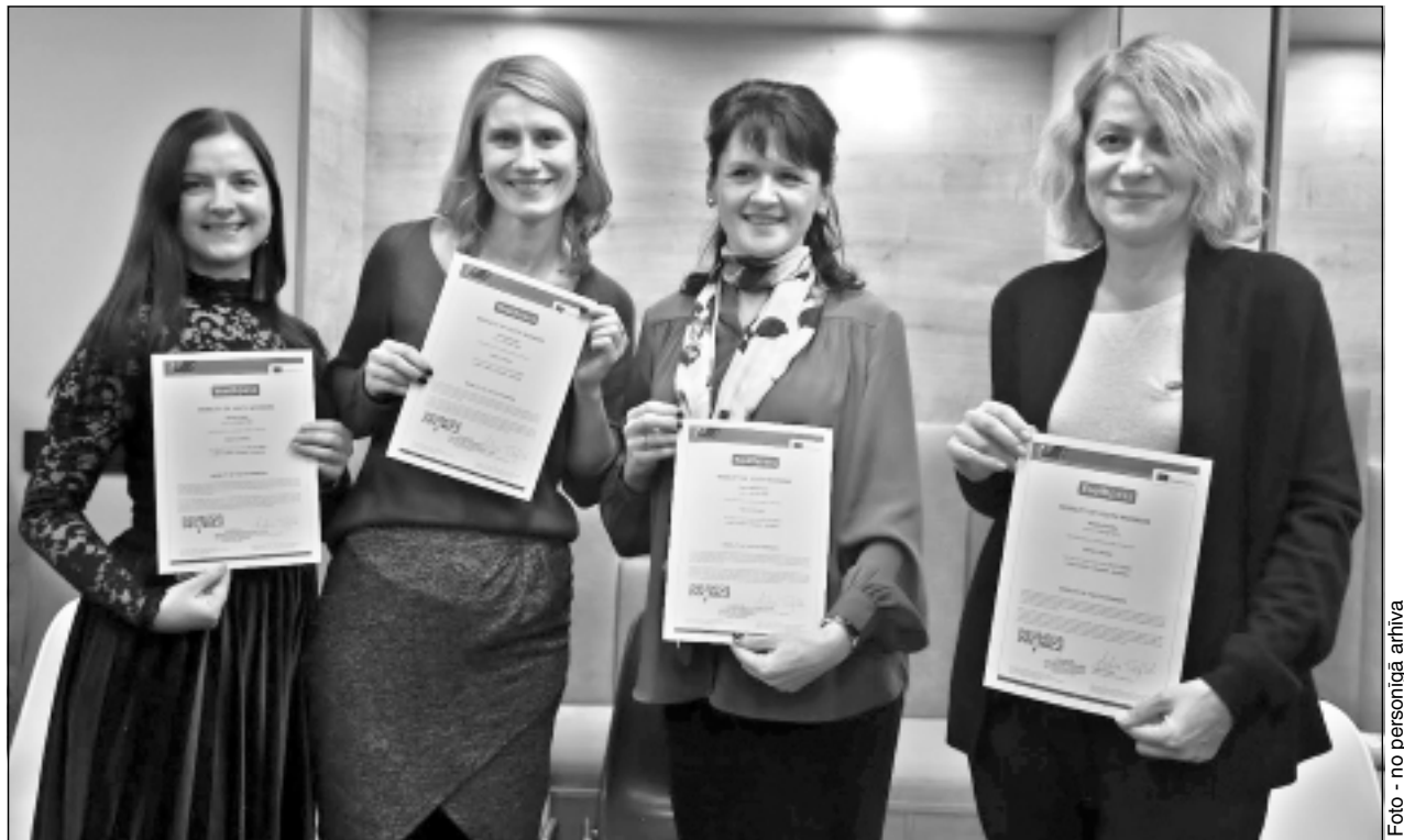
legūtas jaunas zināšanas. Visi dalībnieki saņēma Eiropas Savienības “Youthpass” jeb sertifikātu par dalību šajās apmācībās.

No Baltkrievijas un Ukrainas pārstāvjiem latvietes daudz uzzināja par patieso situāciju viņu zemēs. “Sapratām, ka,