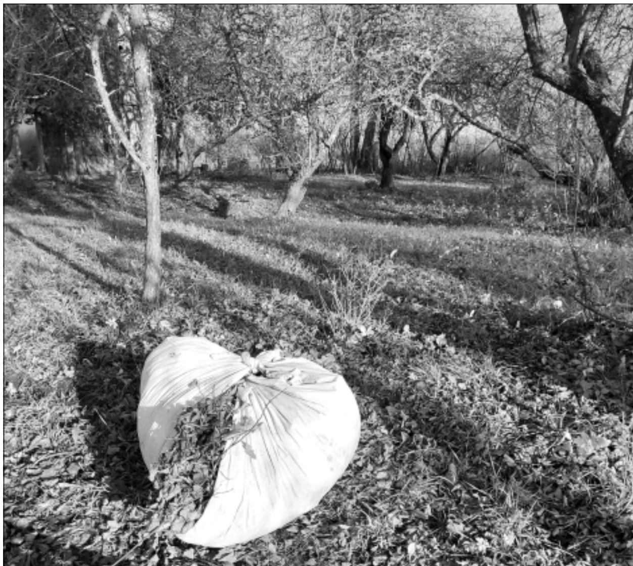
Ar nastu ērtāk. Velgai lapu vai citu dārza atkritumu aizvākšanai patīk izmantot nastas metodi: saber nesamo lielā nastā, sasien segai stūrus, uzvel uz muguras un aiznes, kur vajag.

Lūk, ko stāsta pati: "Iedomājoties par dārzu, uzreiz prātā nāk vecvecāki, kuri šo zemes gabalu iegādājās, tad kara laikā zaudēja, un pēc tam to varēja atgūt Latvijas atjaunošanas laikā. Mūsu bērni ir jau ceturta paaudze, kura aprūpē šo teritoriju. Tas ir krietns pushektārs zemes pilsētas vidū ar 100-gadīgiem vītoliem, diķi un augļu kokiem. Padomju laikā tur bija mazdārziņi. Mūsu lielākie darbi ir zāles pļaušana, kas aizņem vismaz četras stundas vienu līdz divas reizes nedēļā. Savukārt rudeni vai nedēļu ilgi jāvāc sausās lapas.