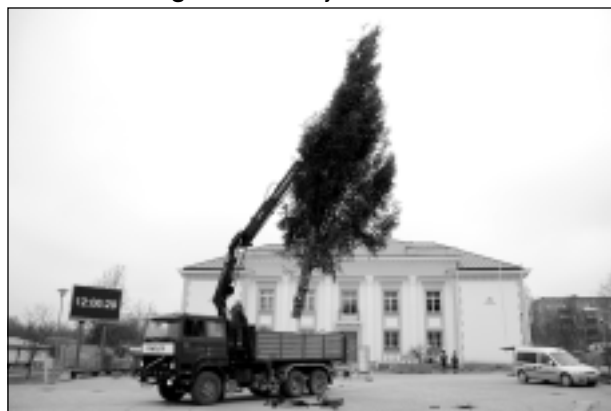
Vai šogad būs? Iesūtīja Pēteris no Balviem.