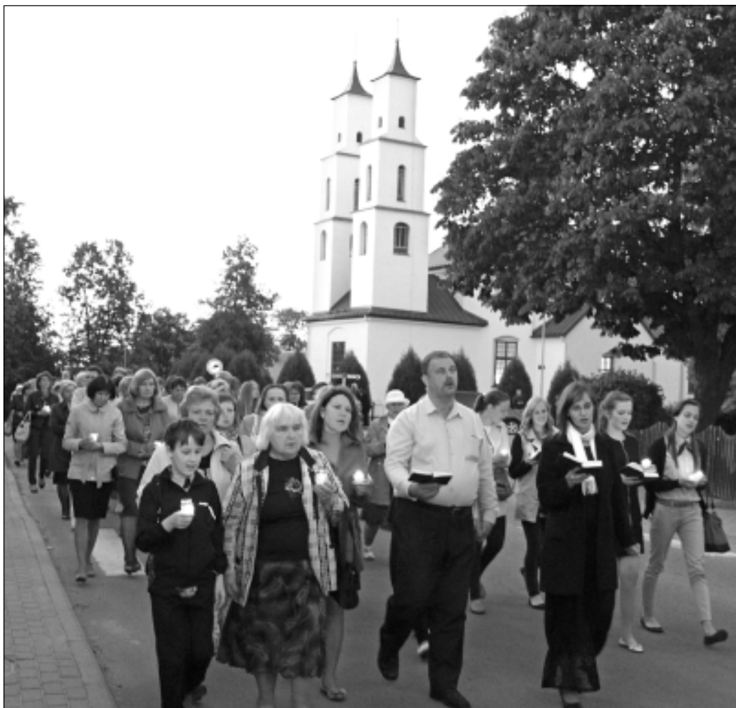
Baznīcu nakts Balvos.

Katra mēneša labākās fotogrāfijas autors saņems balvu. Fotogrāfijas var iesūtīt pa pastu – Balvi, Teātra ielā 8, LV-4501, vai elektroniski: vaduguns@apollo.lv . Pie foto obligāti norādāms vārds, uzvārds (vēlams - tālrunis).