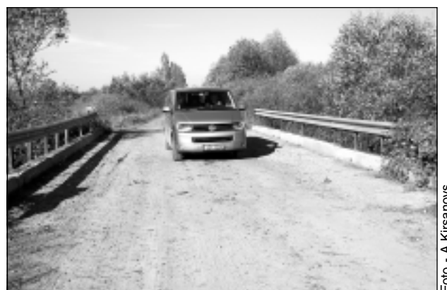
Pa Vecumu ceļiem. Novada domes busiņš šķērsoja vienu no tiltiem, kura margas atjaunotas par pagasta līdzekļiem un pašu spēkiem.