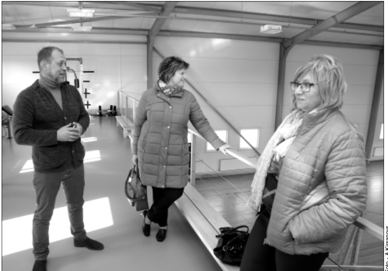
Skats no augšas. Sporta halles augšstāvā interesentiem ir iespēja vingrot, izmantojot trenāžierus.

Arī Vecumu pagastā neizpalika izbraukums pa pašvaldības ceļiem. "Gribu jums parādīt, kur un kā izmantota pašvaldības nauda," teica I.Locāns. Pēc sausās vasaras par grants ceļu stāvokli īpaši sūdzēties nevar. Remontdarbi piecu kilometru garumā nupat veikti uz ceļa Žogova-Tālavieši, kur strādāja