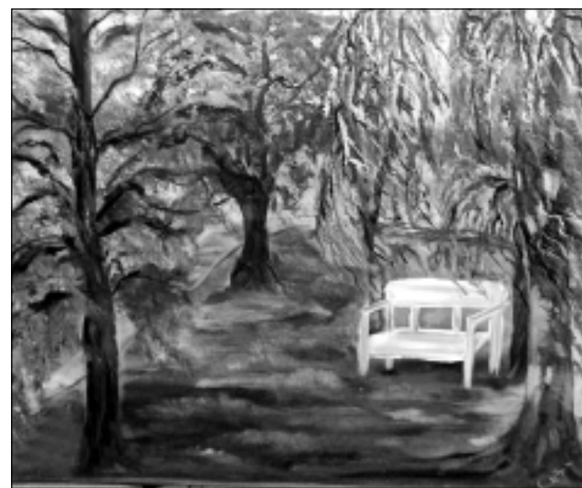
Glezna. Idejas, krāsas un iedvesmu gleznošanai Ilzei Šaicānei bieži vien dāvā daba.