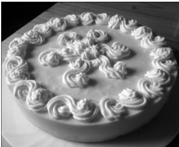
Ķirbju kūka. Gardums, kas rotājas saules krāsā.

(es pirms tam masu vēl sablenderēju, lai nevar saredzēt ķirbja skaidiņas), samaisa, tad pievieno uzbriedinātu un izkausētu želatīnu. Lej masu formā ar cepumu pamatni un liek aukstumā, lai sastingst. Vislabāk pagatavot vakarā un atstāt līdz rītam ledusskapī. Dekorē, un kūka gatava!