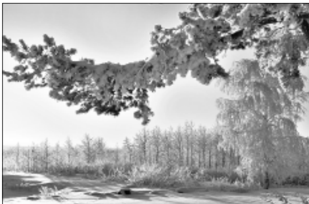
Daba pie Peipusa ezera. Spēcīgus pārdzīvojumus fotogrāfi gūst, vērojot un iemūžinot dabas ainavas ziemā. Turklāt ir garantija, ka divu vienādu fotogrāfiju nebūs!