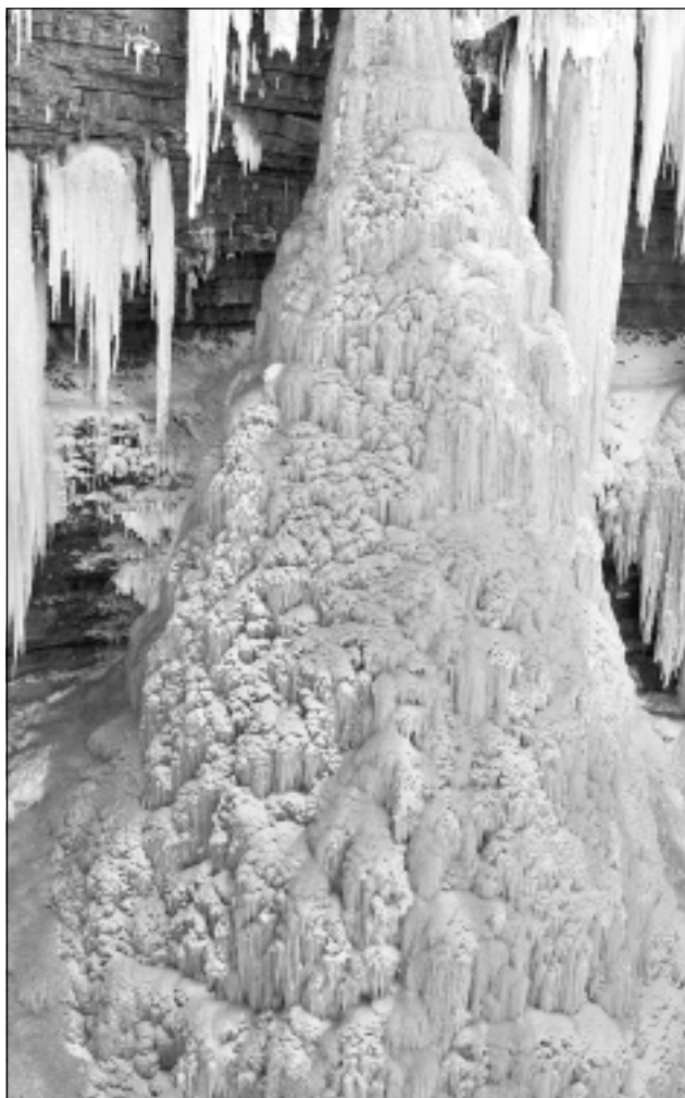
Baltais brīnums. Igaunijā savs ziemas brīnums ir 25 metrus augstais Valastes ūdenskritums, kas Somu jūras liča vēju un temperatūras maiņu rezultātā sasalis ledū, veidojot fantastisku ainavu. Valastes ūdenskritums, kas vasarās gāžas no 24m augstuma, ir Baltijas augstākais ūdenskritums, populārs tūrisma objekts. Valastes ūdenskritumu ir vērts redzēt vismaz trīs dažādos gadalaikos. Ziemā Valastes klintīs ir viens no neparastākajiem un skaistākajiem Baltijas ledus veidojumiem – vairāk nekā divdesmit metrus augsts leduskritums. Lielizmēra lāstekas, šķiet, var ieraudzīt tikai pie Valastes.

Mārite Šperberga, 2010. gada 24. janvārī