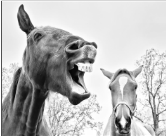
Korifejam labs noskaņojums. Nez ko domā Simpātija, kad Korifejs tā smaida...

Jāpiebilst, ka ģimeni vieno arī skaistā, dzidrā latgaliešu valoda, ko viņi lieto gan mājās, gan ārpus tās.