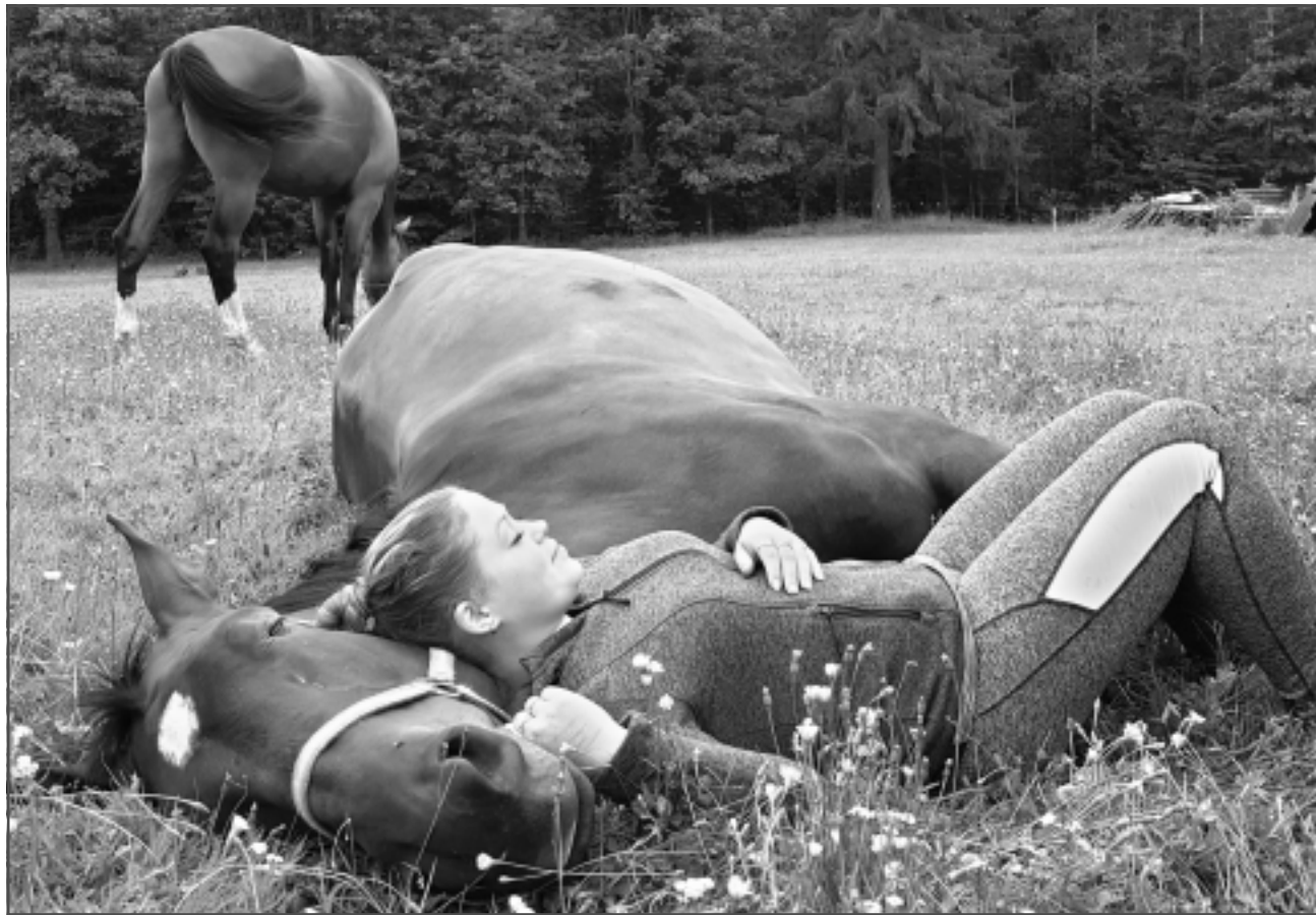
Atpūtas brīdi ar saimnieci. Soprānam ļoti patīk draudzēties un miļoties, piemēram, var nolaizīt seju vai roku no pleca līdz plaukstai.